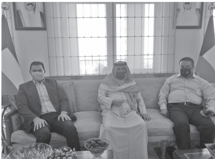
الامير الراحل حضره صاحب السمو الشيخ صباح الاحمد الجابر الصباح طيب الله ثراه وذلك في مقر سكن السفير