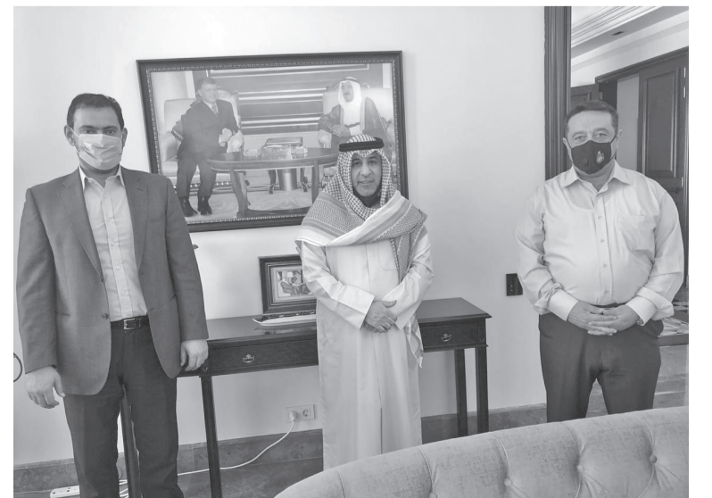
وزير الصناعة والتجارة والتموين ووزيرالدولة لشؤون مجلس الوزراء سامي الداود لتقديم التعازي ب الغفور له