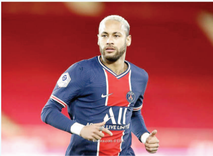
باريس - وكالات

اللاعب منزلًا أيضًا. وليؤكد أنه لم يعد في مانجاراتيبا، نشر نجم المنتخب البرازيلي، عبر حسابه على (إنستغرام)، صورة يظهر فيها على متن يخت مع صديق قبالة شاطئ كايشا داسو، الواقع بولاية سانتا كاتارينا الجنوبية والقريب من كامبورييتش. وتزامنت رحلة نيمار مع نشر رسالة ينفي فيها متحدثون باسمه ما تناقلته الصحف منذ عدة أيام، بشأن تنظيمه للحفل المثير للجدل. وأوضح متحدثون باسمه في رسالة عبر مواقع التواصل الاجتماعي، أن نيمار «لن يدعو لأي حفل هذا العام. نحن في خضم جائحة، وهو مع أصدقائه وأسرته وسيفتحون بالعام الجديد مع بعضهم البعض».