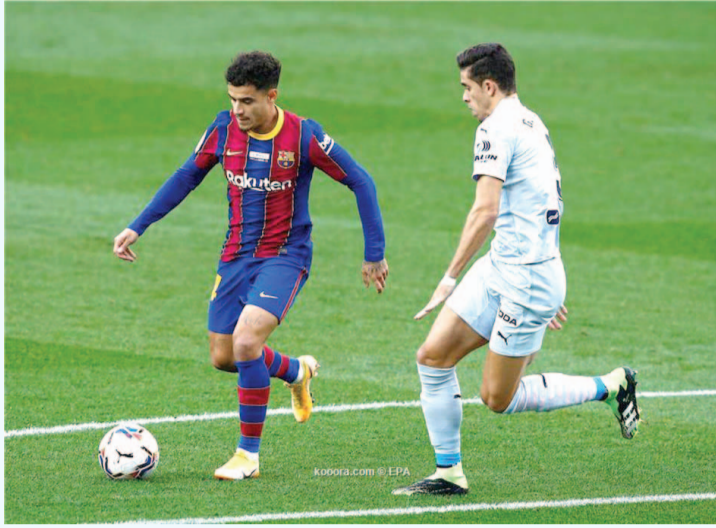
برشلونه

لضم لاعبين جديدين في يناير/كانون ثان المقبل، على الرغم من تحديد اسم ممفيس دييبي، مهاجم ليون، والذي يرحب بالقدوم إلى البرسا، رغم العرض المغربي من باريس سان جيرمان. وأضادت الصحيفة، بأن برشلونه في حاجة للتخلص من أحد لاعبيه أولاً، من أجل تحقيق الدخل اللازم لشراء دييبي وتوفير راتبه، قبل عقد الصفقة، وهو السبب نفسه الذي أدى لفشل الصفقة في الصيف. ومن المتوقع أن تترك الإدارة المؤقتة الحالية لبرشلونه الوضع كما هو، لحين قدوم مجلس إدارة جديد يوم ٢٤ يناير/كانون ثان المقبل، ويصبح أمامه أسبوع لحسم ملف الصفقات الجديدة.