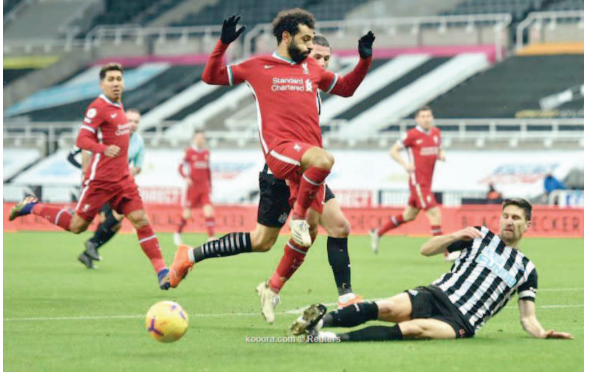
لندن - وكالات

وقبل بداية الموسم عرف ليفربول أنه سيواجه صعوبات للاحتفاظ باللقب الذي أحرزه في الموسم الماضي بفارق ١٨ نقطة عن صاحب المركز الثاني. وفي موسم متقلب خسر الفريق مرة واحدة في ١٦ مباراة وهو ما يوضح القوة الذهنية للاعبيه. وقال كلوب، «أخبر ما أفكر فيه هو مركزنا في الدوري في الوقت الحالي. إنه جيد لكن لا يعني أي شيء». وزاد «تعدلتا وما زلنا في الصدارة وهذا ما يوضح مدى صعوبة الموسم على الجميع». وأضاف «يجب علينا قدماء، المباريات المقبلة أمام ساوثهامبتون وأستون فيلا ومانشستر يونايتد ومن الجيد أننا نعرف مسؤولياتنا. لم نحصل على النتيجة التي كنا نريدها لكنها ليست أسوأ شيء فهناك أمور أسوأ تحدث».