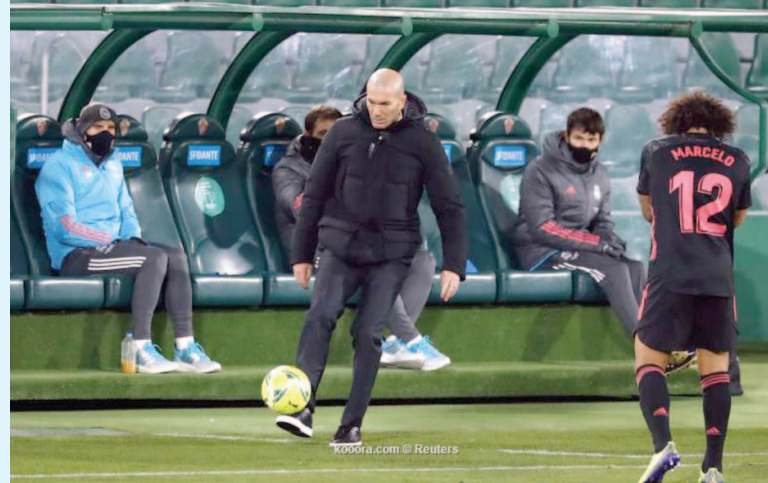
مدريد - وكالات

وسعيد بالجميع في المباراة، وأولئك الذين يلعبون مباريات أقل. وحول أحقية بنزيميا في الحصول على ركلة جزاء، علق: «إذا لم يطلق الحكم صافرته، فليس هناك شيء». وأتم زيدان: «اقترب ألتيتيكو من مدريد من اللقب؟ الموسم طويل جداً، وهناك طريق طويل لنقطعه، وستخسر جميع الفرق نقاطاً».