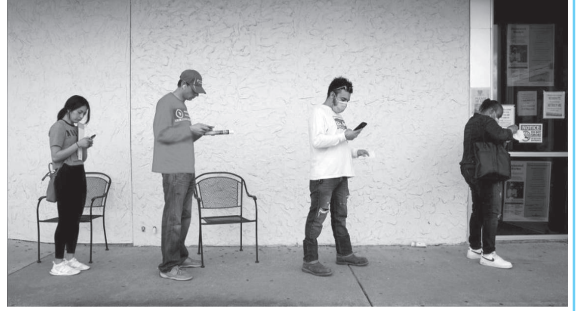
لندن - العربية

اطلعت عليه «العربية نت» إن مؤسسات الأكل والشرب في الولايات المتحدة خسرت ٣٧٢ ألف وظيفة خلال الشهر الماضي وحده، لتسجل بذلك أول انخفاض لها منذ أبريل ٢٠٢٠ عندما تم تسريح ٥,٤ مليون شخص. ودفعت الزيادة القياسية في حالات الإصابة بفيروس كورونا المزيد من الولايات مثل كاليفورنيا ونيويورك إلى الحد من ساعات عمل المطاعم أو تقيد عدد العملاء أو حتى حظر تناول الطعام في الأماكن المغلقة تماماً.