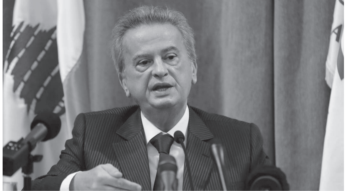
دبي - العربية

ويعد كلام حاكم مصرف لبنان، اشتعلت مواقع التواصل الاجتماعي غاضبية. وانتشر هاشتاغ #لبنان_ليس_بخير. وانهمرت التعليقات المختلفة، منها: «سعر صرف الدولار كل يوم يزيد، أسعار المواد الغذائية موجعة»، «شبابنا صاروا عاطلين عن الدراسة ومث بس عن العمل»، «نحن لسنا بخير»، «عندما نقف طوابير أمام كل مشومات حياتنا اليومية البديهيّة يصبح #لبنان_ليس_بخير»، وغيرها من التعليقات التي تعكس الوضع المأساوي والكارثي الذي يعيشه اللبنانيون.