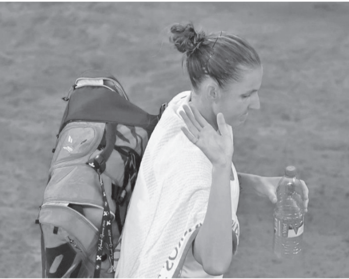
ابو ظبي - وكالات

جاسانوفاً إلى ٧٢ دقيقة للتغلب على بليسكوفاً والتأهل إلى دور الستة عشر للبطولة حيث ستلحق الإسبانية سارا سورييس تورمو. وتلقت بليسكوفاً المصنفة السادسة على العالم أول هزيمة لها أمام لاعبة لا تنتمي للمراكز ٥٠ الأولى في التصنيف العالمي، منذ هزيمتها أمام إيلينا أوستينكو في بطولة بكين ٢٠١٩، عندما كانت أوستينكو تحتل المركز ٧٣ في التصنيف حينذاك. ويأتي الخروج المبكر لبليسكوفاً من بطولة أبو ظبي رغم أنها توجت باللقب في أول بطولة لها في ثلاثة من المواسم الأربعة الماضية، حيث أحرزت لقب بطولة برزبين في كل من مواسم ٢٠١٧ و٢٠١٩ و٢٠٢٠.