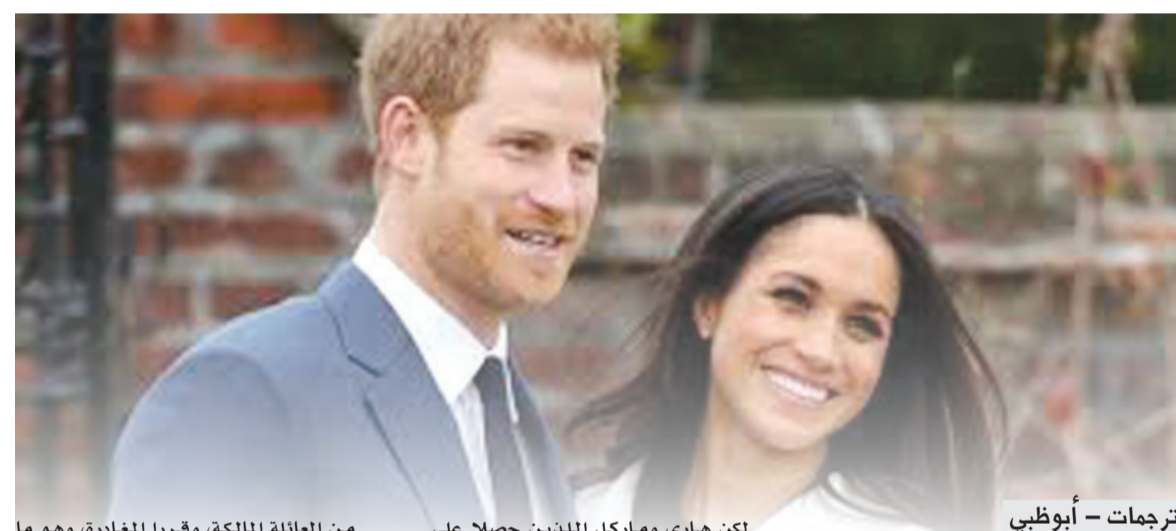
ترجمات - أبو ظبي

من العائلة المالكة، وقررا المغادرة، وهو ما أدى إلى عدم إكمال السنوات الثلاث التي تشترطها وزارة الداخلية بشكل صارم. ولم يقتصر إخلال ماركل على هذا الجانب فقط، بل أخفقت في أمر آخر كان سيرهما من الحصول على الجنسية حتى لو مكثت 3 سنوات. ويشترط القانون البريطاني أن يكون الراغب في الحصول على الجنسية قد قضى أقل من 70 يوماً خارج البلاد، خلال السنوات الثلاث السابقة، وهو ما لم تراعه ميغان. وفي حال أرادت ماركل أن تحصل على الجنسية، فإن عليها أن تقضي وقتاً أطول في بريطانيا، مستقبلاً.