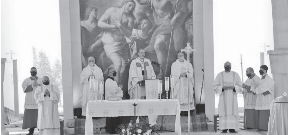
المفطس - الانباط

أحبت الكنائس الكاثوليكية بالملكة ذكري عماد السيد المسيح امس السبت في موقع المفطس بحضور رؤساء الكنائس ورجال الدين المسيحي وامين عام وزارة السياحة، والسفير البابوي في الأردن.