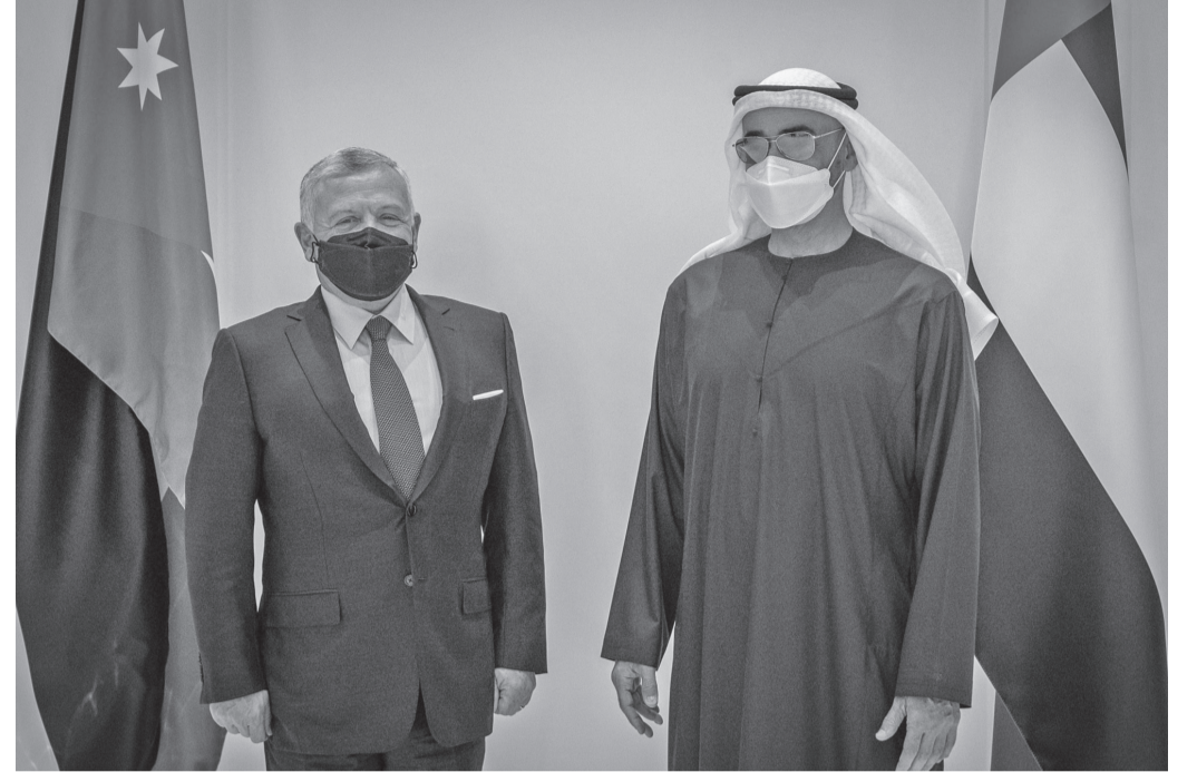
الإنباط - أبوظبي

الشيخ محمد بن زايد آل نهيان ولي عهد أبوظبي، نائب القائد الأعلى للقوات المسلحة في دولة الإمارات العربية المتحدة الشقيقة، اعترازهما بالعلاقات