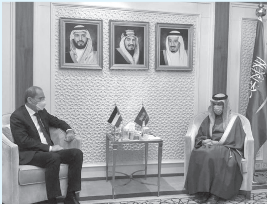
الإنباط - الرياض

قائدنا حيث يجمعنا الكثير من الصالح المشتركة والتي تعزز بالعمل المشترك مع بعضنا البعض. وقال الصديقي إنه فيما يتعلق بالقضية الفلسطينية، القضية المركزية الأساس، موقف الملكين واحد، نريد سلاماً عادلاً شاملاً قائماً على حل الدولتين الذي يجسد الدولة الفلسطينية المستقلة ذات السيادة وعاصمتها القدس المحتلة على خطوط الرابع من حزيران 1967، وفقاً للمرجعيات الدولية ومبادرة السلام العربية حتى تنعم منطقتنا بالسلام الذي نستحقه وتحتاجه. وأكد الصديقي تضامناً الأردن والسعودية في مواجهة التحديات المشتركة، مشيراً إلى تأكيد جلالته الملك عبدالله الثاني، بأن أمن السعودية جزء من أمن الأردن، وبالتالي نحن نقف مع الأشقاء في كل الخطوات التي يتخذونها من أجل حماية أمنهم واستقرارهم. وزاد «نتفق على رفض التدخلات في الشؤون العربية أياً كان مصدرها، ونتفق أيضاً على أننا