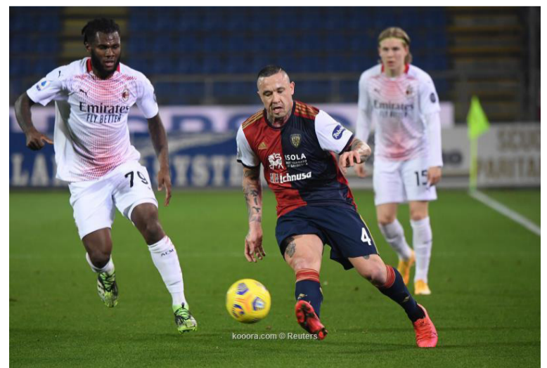
كوبورا - وكالات

الأحد الماضي، لكنه رد على ذلك بشكل جيد بفوزه بالنتيجة ذاتها على نابولي ليفوز بكأس السوبر المحلية. ويستضيف يوفنتوس، بولونيا المستقر في منتصف الترتيب، الأحد المقبل، بينما سيلعب نابولي ثالث الترتيب خارج الديار مع فيرونا، ويستقبل لاتسيو