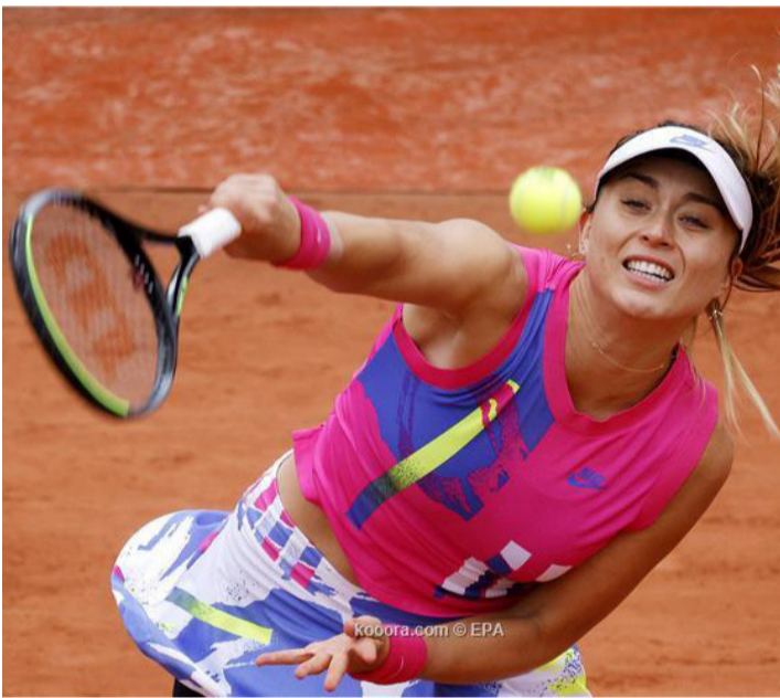
سيدي - وكالات

وخضعت للحجر المنزلي في غرفتي، واليوم بعد مرور سبعة أيام، جاءت نتيجة فحوصاتي إيجابية. وتابع أعاني من أعراض، وأمل في التعافي في أقرب وقت.. إنها أوقات صعبة، شكرا لكم على الدعم، وسأعود أكثر قوة. وينبغي على بادوسا الخضوع للحجر ١٤ يوما، منذ وصولها إلى ميلبورن في منتصف يناير. بعد توجهها إلى المدينة على متن طائرة قادمة من أبو ظبي.