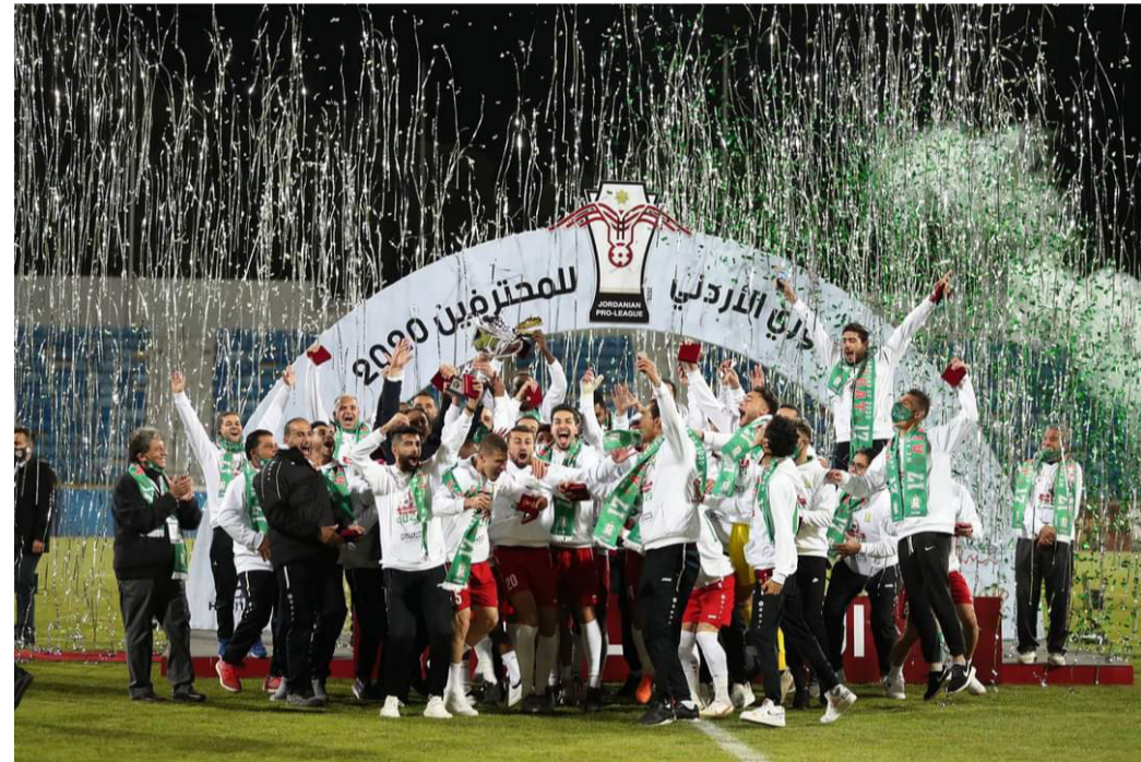
مليزيا - وكالات

أعلن الاتحاد الآسيوي لكرة القدم الجمعة، عن سحب قرعة دور المجموعات لدوري أبطال آسيا وكأس الاتحاد الآسيوي عبر تقنية الفيديو يوم ٢٧ كانون ثان/يناير ٢٠٢١ في العاصمة الماليزية كوالالمبور. وتشهد البطولتان مشاركة قياسية من ناحية عدد الأندية خلال نسختي عام ٢٠٢١، حيث تم إضافة مجموعتين إضافيتين، واحدة للشرق وواحدة للغرب، وتم توسيع البطولة لتضم ٤٠ نادياً بدلاً من ٣٢. في المقابل ارتفع عدد الأندية المشاركة في دور المجموعات لكأس الاتحاد الآسيوي من ٣٦ إلى ٣٩ نادياً، حيث تم إضافة مجموعة جديدة في منطقة الوسط. ومن بين الأندية التي تخوض المشاركة الأولى في تاريخ دوري أبطال آسيا، يبرز نادي الوحدات بطل الدوري الأردني، وجوا الهندي، والاستقلال الطاجيكي وصيف بطل كأس الاتحاد الآسيوي مرتين، في منطقة الغرب، وكذلك يوناندي سيتي من الفلبين وتامبينز روفرز السنغافوري وفيتال فيتنامي، في مجموعات الشرق. ويأمل نادي أولسان هيونداي المتوج حديثاً في أن يتنجح بالاحتفاظ بلقب دوري أبطال آسيا، ليكرز إنجاز نادي الاتحاد السعودي الذي توج باللقب عامي ٢٠٠٤ و٢٠٠٥.