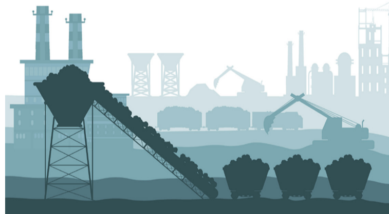
بكين - فرانس برس

تطلق الصين في الأول من شباط/ فبراير سوقها الخاصة بحقوق التلوث الذي ينتظره مناصرو حماية البيئة بفارغ الصبر، إذ وعدت أكبر دولة مسيبة للتلوث في العالم ببلوغ الحياد الكربوني في عام 2060.