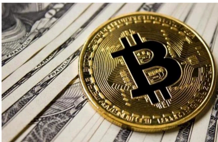
ستغافورة - رويترز

إلى أن جزءا من بيتكوين ربما يكون جرى إفصاحه مرتين كان كافيا لإطلاق عمليات بيع، حتى إذا جرت تهدئة هذه المخاوف لاحقا.