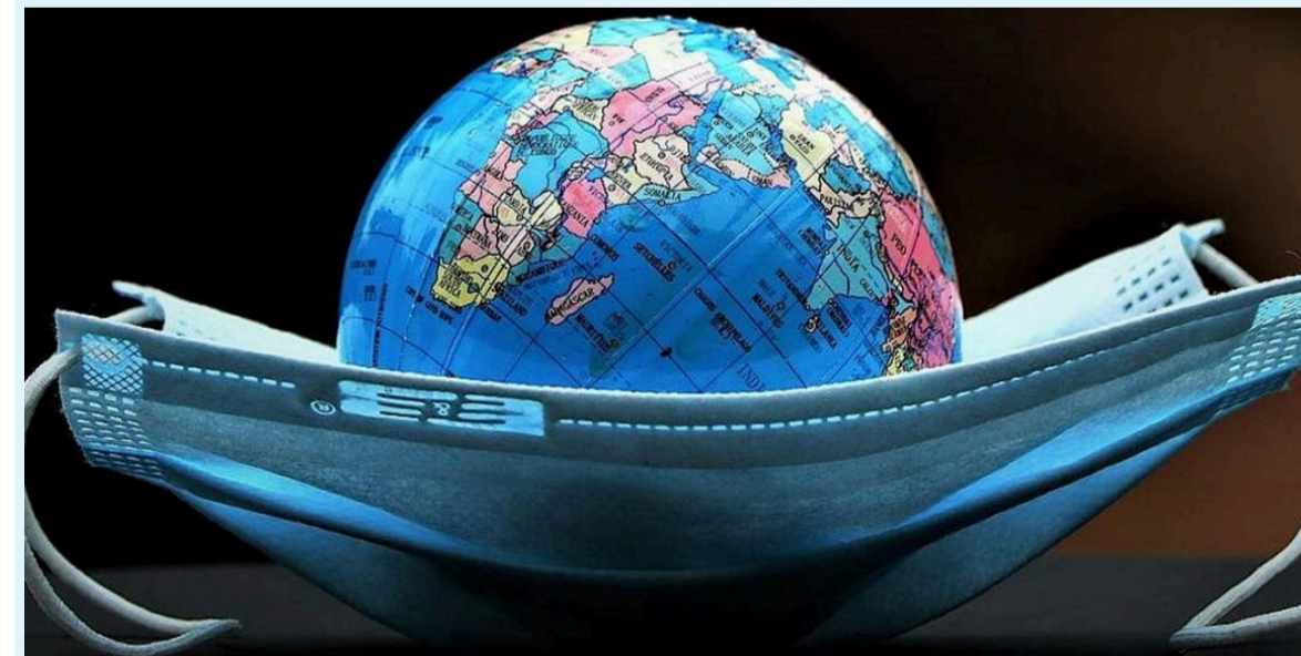
لندن - العربية

خلصت دراسة اقتصادية أجريت حديثاً إلى أن الكارثة المالية التي تسببت بها جائحة كورونا للعائلات في العالم سوف يستمر تأثيرها لثلاث سنوات مقبلة على الأقل، وهو ما يعني أن إنفاق المستهلكين قد يظل متأثراً بهذه الأوضاع لمدة أطول مما كان متوقفاً بما قد يؤثر على الأسواق وقطاع التجزئة في مختلف أنحاء العالم. وتوصلت الدراسة المسحية التي نشرت نتائجها جريدة "ديلي ميرور" البريطانية، واطلعت عليها "العربية نت" إلى أن الأسر تعتقد أن الأمر سيستغرق ثلاث سنوات في المتوسط حتى تتعافى مواردها المالية بالكامل من تأثير جائحة فيروس كورونا.