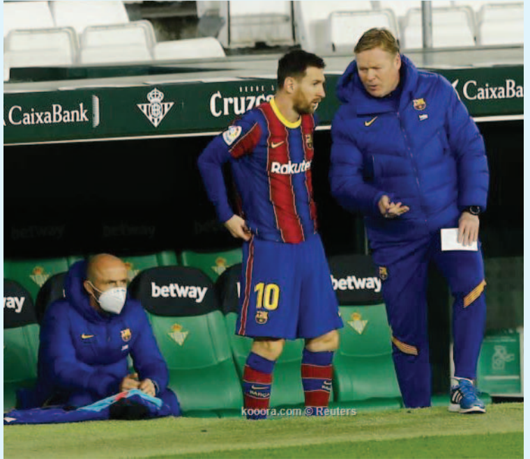
مدرّب - وكالات

أبدى رونالد كومان المدير الفني لبرشلونة، سعادته بالانتصار (٣-٠) على التنشي، مساء الأربعاء، والموجة من الجولة الأولى بالليجا. وقال كومان خلال تصريحات نقلتها صحيفة ماركا، كنا بحاجة إلى الفوز اليوم، ظهرنا بشكل رائع في الشوط الثاني وصنعنا الفارق، في الشوط الأول كان يجب تقديم مستوى أفضل.. وأضاف "ه تغييرات؟ قررنا التبديلات لإنعاش الفريق، هناك العديد من المباريات التي نصل إليها مرهقين ونفتقر للطاقة، ولحسن الحظ وضعنا المزيد من الطاقة في الشوط الثاني للتسجيل وتسهيل الأمور.. وتابع "بشكل عام يمكن التعادل في مباراة على أرضك، لكن النقاط التي خسرتها في بداية الموسم، جعلنا في وضع لا يسمح لنا بخسارة المزيد.. وأردف "إذا تواجد ميسي بين الخطوط، يكون ذلك أفضل، لأنه يهرق