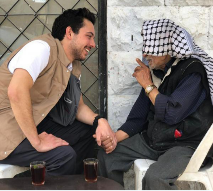
التفاصيل ص «٢»