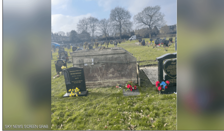
العمر. وبحسب صحيفة "ميرور" البريطانية،