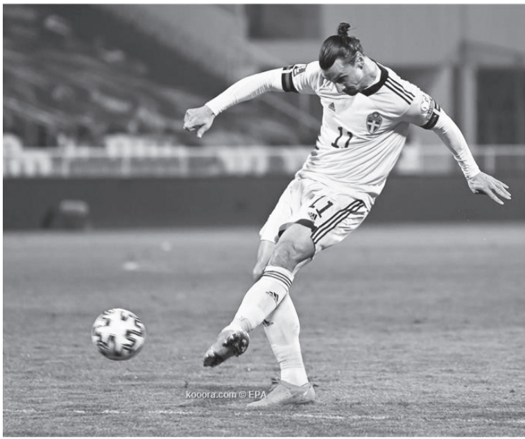
السويد - وكالات

قال النجم المخضرم زلاتان إبراهيموفيتش، قائد السويد، عقب انتصار منتخب بلاده على كوسوفو (3-0) في ثاني جولات المجموعة الثانية بالتصفيات المؤهلة لمونديال 2022 بقطر، إنه كان يشعر بالرضا بدوره كصانع للأهداف، وواصل "السلطان" مساعدة زملائه عقب عودته من جديد لقيادة المنتخب الإسكندنافي بعد 8 سنوات من الغياب، حيث صنع هدف انتصارهم على جورجيا في المباراة الافتتاحية قبل أيام، ثم صنع الهدف الأول في شيك كوسوفو. وقال مهاجم ميلان الإيطالي في تصريحات بعد المباراة: "قلت لهم إنني لا