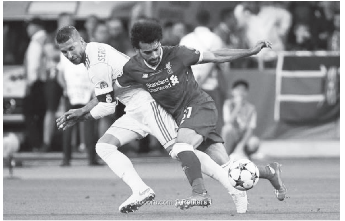
مدريد - وكالات

مع تشيلسي، لكنه غير محظوظ، وكذلك لوكا مودريتش التفتت به أكثر من مرة، وتطرق صلاح للحديث عن فينيسيوس جونيور لاعب الريال: "لا داع للقلق على فينيسيوس، لم أولد هدافا، لكن عملت بجدية لأصل لعدلي الحالي، عندما كنت في صفوف تشيلسي وفيورنتينا وروما، وفي العاصمة الإيطالية عملت كثيرا مع سباليتي، الذي ساهم في تحسين قدراتي أمام الرمي بتدريبات يومية متخصصة، كما بنيت ملعبا خاصا في منزلي للتدرب على بعض الألعاب، حاسة الهدف تحتاج لعمل متواصل، ومع الوقت ستحسن الأمور، كل ما يحتاجه فينيسيوس أن يتدرب كثيرا، واستطرد "زيدان مدرب رائع، لقد فاز بدوري الأبطال 3 مرات، ويقوم بعمل مميز مع ريال مدريد، لقد عاد مجددا لمساعدة الفريق في الفوز بالألقاب مرة أخرى، كما كان قدوة لي عندما كنت صغيرا.. وفسر محمد صلاح تذبذب نتائج فريقه هذا الموسم، قائلا: "لقد تداخلت عوامل عديدة منها أن الحظ لم يكن حليفنا، ابتعدنا عن لقب الدوري، مما ضاعف من إصرارنا على الفوز بدوري الأبطال، وأتمنى أن نتجح في ذلك.. ويسأله هل ترى نفسك في ناد آخر بعد 4 مواسم بقميص الريال، وهل اقتربت مسيرته مع النادي الإنجليزي من النهاية، رد محمد صلاح: "الامر لا يتعلق بي فقط، سنرى ما سيحدث، ولكني أفضل عدم الحديث عن هذا الأمر في الوقت الحالي، وبشأن إمكانية خوض تجربة جديدة في الدوري الإسباني بعد اللعب في إيطاليا وإنجلترا، ختم صلاح تصريحاته: "أتمنى الاستمرار في الملاعب لسنوات عديدة، ولما لا أعب في الليجا، لا يعرف أحد ما سيحدث في المستقبل، ربما يوما ما أعب في إسبانيا،