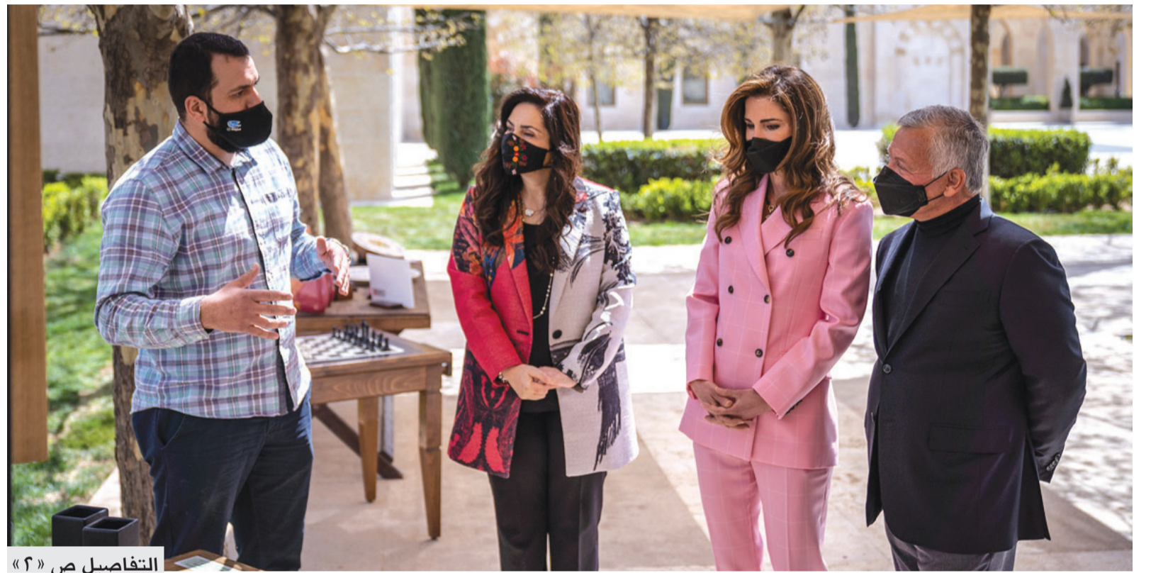
التفاصيل ص «٢»