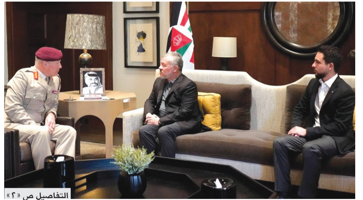
التفاصيل ص « ٢ »