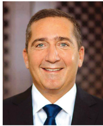
الانباط - كتب عمر كلاب

في اللحظة التي كان احد اعضاء اللجنة الكهول يجر قدميه جزاً للوصول الى خيمة اجتماع اللجنة، كان شاباً يقفز باتجاه مقدمه معاقاً في الطريق اعضاء اللجنة مباركاً، قفزة الشاب وجر القدمين ليست المشاركة الوحيدة او الصدمة في الاجتماع الاول للجنة منوط بها تطوير الحالة السياسية في البلاد، فسرعان ما ظهرت علامات امتعاض على وجوه كثير من اعضاء اللجنة نتيجة ترتيب الجلوس في الخيمة الاليفة التي جرى اعدادها من كادر التشريعات الملكية بعناية فائقة، تتلائم واشتراطات الحالة الوبائية، فأنافة الخيمة لم تشفع من الامتعاض بعد استخدام الترتيبية الوظيفية او الخدمة الرسمية في حسم مقاعد الدرجة الاولى والجالسين عليها من شخص في تقدير كثيرين هم سبب الازمة وحالة الانسداد التي وصلنا اليها وأسهمت في اخراج اللجنة الى حيز الوجود. كانت تلك انطباعات الانباط التي حضرت الجلسة الاولى.