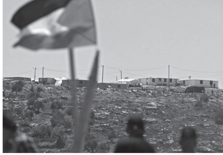
الأراضي التي أقيمت عليها البؤرة الاستيطانية، وأنه تقدم بهذا الطلب بعد صدور رأي جاء فيه أن بعض هذه الأراضي لم يتم حرثها خلال السنوات

أفادت هيئة الإذاعة العامة الإسرائيلية امس السبت، أن الجيش والشرطة الإسرائيلية مستعدون لإخلاء بؤرة أفيطار الاستيطانية على جبل صبيح في بيتا ونقلت عن مصدر أمني إسرائيلي أنه كان يجب القيام بهذه الخطوة قبل حوالي شهر وأشارت الإذاعة إلى أن وزير جيش الاحتلال بيني غانتس معني بإتمام عملية الإخلاء على جناح السرعة من خلال التحاور مع المستوطنين لتجنب اللجوء إلى خطوات عنيفة وكان عضو الكنيست الإسرائيلي موشيه اربيل طلب في وقت سابق الاستفسار من غانتس حول مكانة