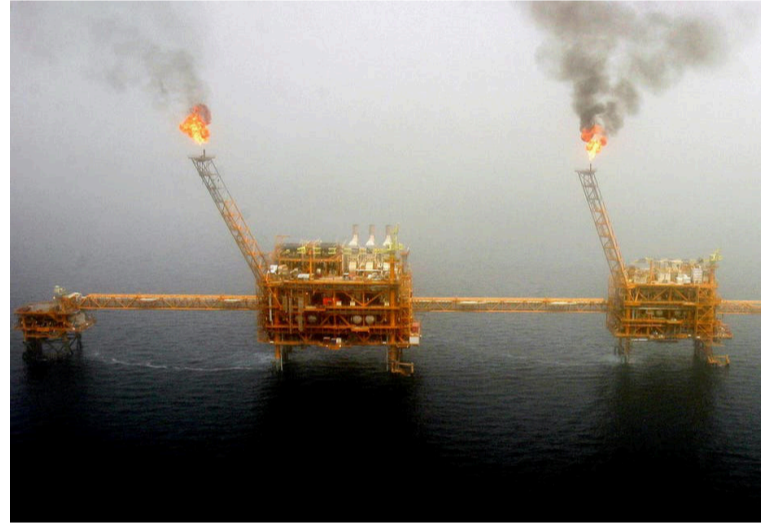
«أوبك» الإنتاج. ويقول المندوبون إن الزيادة تجري مناقشتها بشكل غير رسمي.

وتضمن القوانين إجراءات تمنع عملاقة التكنولوجيا من تشغيل منصة لأطراف ثالثة، وعرض خدمات تنافسية على تلك المنصات في الوقت ذاته ما يشكل ضربة لشركات على غرار أبل وأمازون. كما يسعى الكونغرس إلى منع شركات التكنولوجيا من منح أولوية لمنتجاتها وخدماتها، في خطوة تستهدف غوغل على وجه الخصوص.