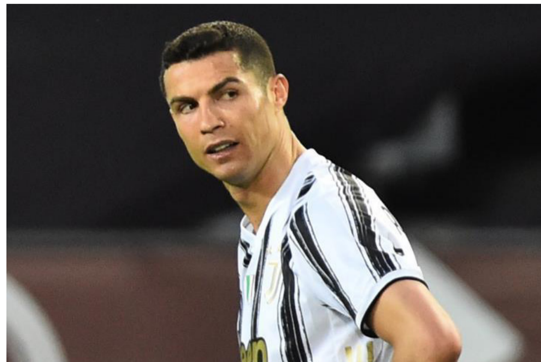
روما - وكالات

يستعد مسؤولو يوفنتوس لدعم الفريق بقوة خلال الميركاتو الصيفي الحالي، في حالة رحيل النجم البرتغالي كريستيانو رونالدو. وينتهي عقد رونالدو مع يوفنتوس في صيف 2022، لكن زعمت تقارير أن اللاعب يفكر في الرحيل وسيلعب النادي بقراره عقب انتهاء اليوم. ووفقاً لصحيفة «كورييري ديللو سبورت» الإيطالية، فإن رحيل رونالدو سيسمح ليوفنتوس باستهداف بعض الأسماء الكبيرة هذا الصيف، مثل أنطوان جريزمان (برشلونة)، وجابريل جيسوس (مانشستر سيتي). وأشارت إلى أن يوفنتوس ارتبط أيضاً بضم دوسان فلاهوفيتش مهاجم فيورنتينا، في الأشهر الأخيرة، كما يمكن أن يتحرك اليو في صوب إيدين دجيكو من روما أو ماورو إيكاري من باريس سان جيرمان. وأوضحت أن ماسيميليانو ألجرجي، مدرب يوفنتوس، طلب التعاقد مع مهاجم جديد بغض النظر عن مصير كريستيانو رونالدو، لأنه يريد 4 مهاجمين في الفريق. وذكرت أن يوفنتوس سيستعد المهاجمين المكلفين مادياً من حساباته مثل أنطوان جريزمان وجابريل جيسوس، في حالة بقاء النجم البرتغالي صاحب الـ 36 عاماً.