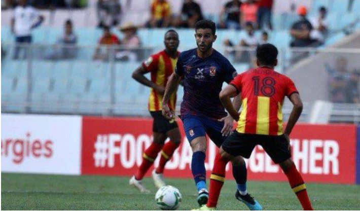
القاهرة - وكالات

تشيفز في مقر داره. وحاولت إدارة الوداد، توفير كل ما في وسعها لمساعدة الفريق في استكمال مشواره القاري نحو النهائي لتحقيق اللقب الغائب منذ 2017، بتوفير طائرة خاصة لرحلة جنوب أفريقيا رغم بعد المسافة. ويضع الوداد رهانه على تألق هدافه أيوب الكعبي الذي سجل 4 أهداف في النسخة الحالية لدوري الأبطال، بجانب الكرات المتقنة التي يرسلها الجناح السريع محمد أوناجم، بخلاف موهبة وليد الكرتي. لكن كايزر تشيفز يسعى لمواصلة مغامرته مع المدرب ستوارت باكستر، للوصول لنهائي دوري الأبطال للمرة الأولى ويسعى الأهلي لتأكيد تفوقه بعدما فاز على الترجي في مقر داره، إلا أن بيتسو موسيماني المدير الفني لحامل اللقب، طالب لاعبيه بعدم النظر لنتيجة لقاء الذهاب، مؤكداً في تصريحات إعلامية أن الفوز في تونس لا يعني بلوغ النهائي. وحصد الأهلي، 9 ألقاب في دوري أبطال أفريقيا، لكن موسيماني يسعى لكتابة اسمه في تاريخ القلعة الحمراء بالتتويج بلقب دوري الأبطال للمرة الثانية، وهو ما لم يحققه مدرب آخر سوى مانويل جوزيه.