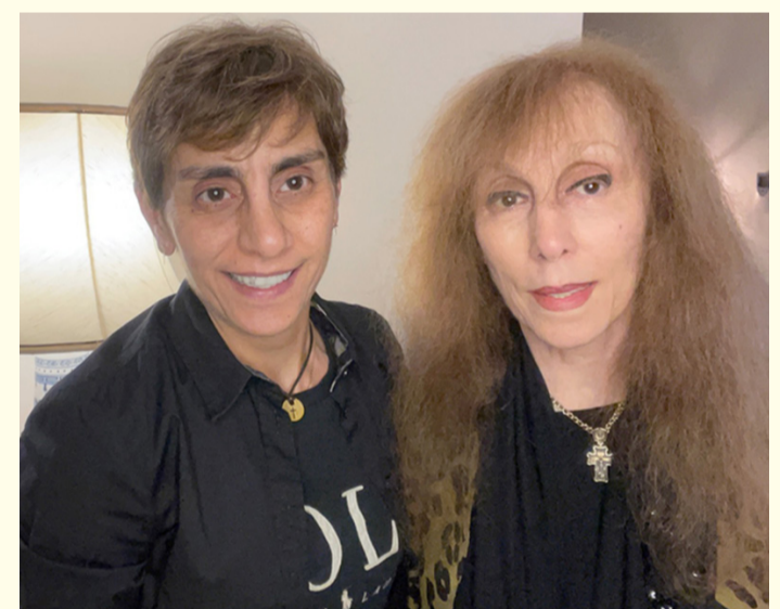
دبي - العربية

في مفاجأة سارة، نشرت ابنة الفنانة اللبنانية الكبيرة فيروز صورة لها مع والدتها عبر حساباتها على مواقع التواصل الاجتماعي مساء الخميس. وأرقت ريمما الرجباني الصورة بتعليق قالت فيه: "سيلفي والماضي خلفي"، وقد حققت الصورة تفاعلاً كبيراً لدى محبي فيروز. يشار إلى أن فيروز تفضل البقاء بعيدة عن الأضواء. يذكر أن آخر ظهور لها كان في سبتمبر 2020، عندما التقى الرئيس الفرنسي إيمانويل ماكرون بمنزلها في الريفية شمال بيروت. كما وصف ماكرون زيارته لفيروز بأنها "جميلة وقوية للغاية"، قائلاً: "تحدثت معها عن كل ما تمثله بالنسبة لي عن لبنان ونحبه ونبغته الكثير منا.. عن الحنين الذي ينتابنا.. إلى ذلك منحها وسام "جوقة الشرف" الفرنسي وهو أعلى تكريم رسمي في فرنسا، وأهدته هي بدورها لوحة فنية.