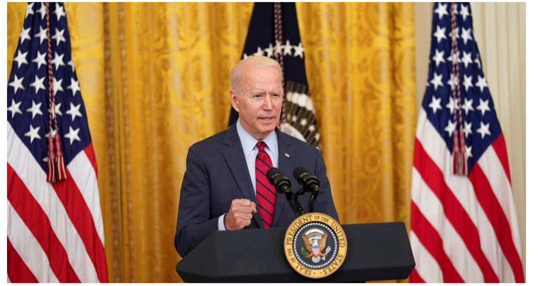
واشنطن- فرانس برس