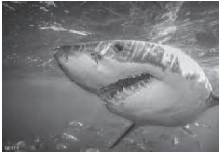
سمكة قرش تهاجم مواطنا في خليج العقبة وتهدد سلامة المتزعمين. وأكدت السلطة أن

نتائج المسح الشامل وعمليات غطس نهائية وليبية أجرتها جمعية العقبة للغوص لجوف البحر لم ترصد أسماك القرش في خليج العقبة حتى اللحظة. وتابع البيان، أن الأجهزة الرسمية تحققت من جميع الروايات بهذا الصدد، واستمعت لأشهادها وصولا إلى معلومة دقيقة وواضحة حول هذه الحادثة، لكن لم ترد أي رواية متماثلة تؤكد وجود سمك القرش قرب شواطئ العقبة. وشددت السلطة على أن عمليات الرصد والمراقبة لشواطئ العقبة بالتعاون مع قيادة القوة البحرية ما زالت مستمرة خلال الأيام المقبلة، داعية مرتادي البحر وأصحاب القوارب السياحية وممارسي الرياضات البحرية ومستخدمي الشواطئ إلى توخي الحيطة والحذر وعدم تجاوز المناطق المخصصة للسباحة أو ممارسة الرياضات البحرية.