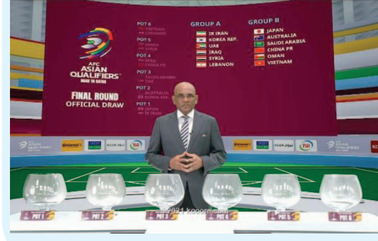
مليزيا - وكالات

فيتمان، عمان، الصين، السعودية، أستراليا واليابان. ويتأهل إلى نهائيات كأس العالم ٢٠٢٢ في قطر، الفريقان الحاصلان على المركزين الأول والثاني في كل مجموعة، في حين يتقابل المنتخبان الحاصلان على المركز الثالث في الملحق الآسيوي، من أجل تحديد المنتخب المتأهل إلى الملحق العالمي. ومن المقرر أن يقام الدور النهائي من التصفيات الآسيوية لكأس العالم عبر ١٠ جولات، وذلك أيام الثاني والسابع من أيلول/سبتمبر ٢٠٢١، والسابع والـ ١٢ تشرين الأول/أكتوبر ٢٠٢١، و١١ و١٢ تشرين الثاني/نوفمبر ٢٠٢١، و٢٣ كانون ثان/يناير ٢٠٢٢ وأول شباط/فبراير ٢٠٢٢، و٢٤ و٢٥ آذار/مارس ٢٠٢٢