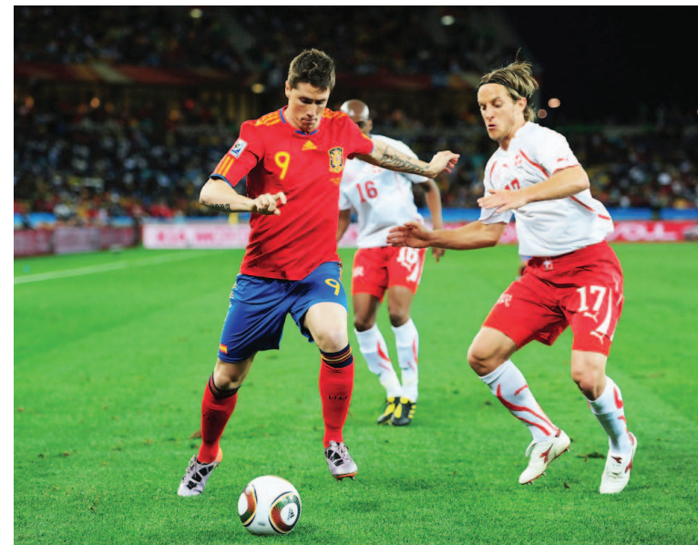
روسيا - وكالات

تأخرها أمام سويسرا لفوز بعدما فشل القائد السابق سيرجيو راموس، الذي يغيب حالياً عن قائمة المنتخب في اليوم، في تسجيل ركلتي جزاء. تقدم السويسريون أولاً عبر ريمو فريير (٢٦) وتعادل إسبانيا قبل دقيقة من نهاية الوقت الأصلي من خلال جيرارد مورينو، وقبل المباراة