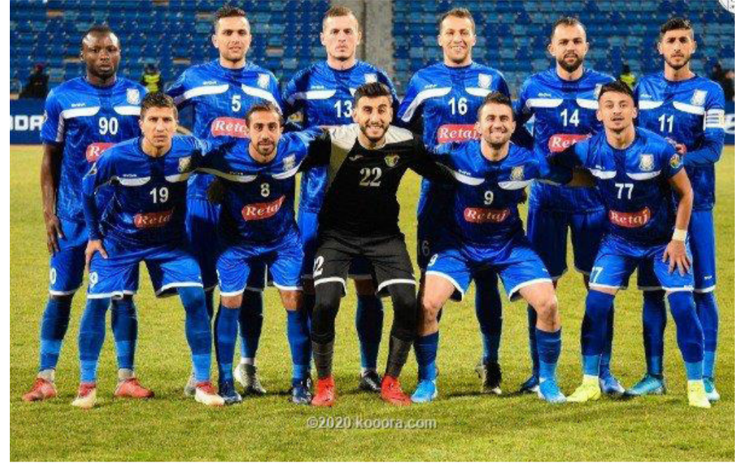
الانباط - عمان التواصل مساء اليوم منافسات بطولة دوري المحترفين الكروي باقامة لقاء وحيد يجمع سحاب مع السلط عند الثامنة والنصف مساء على ستاد الأمير محمد بالزرقاء.