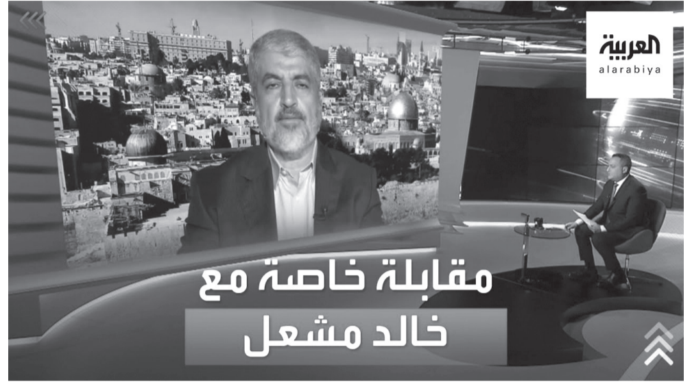
مقابلة خاصة مع خالد مشعل

عقل ذكي كعقل مشعل، لم يغفل ارسال رسائل تظمين للفاخرة عبر السعودية ايضا، تتعلق بموقف الحركة من سد النهضة ووقوفها الى جانب امن مصر القومي والمائي، ولم يغفل عن رسائل الى الامارات والمغرب، باسقاط مفردة التطبيع وشرطها، على اي علاقة قادمة، فالديبلوماسية مشعل أكد بان هذه قرارات سيادية للعواصم، لكن الاجابة الواضح لامتحان الثقة الذي قدمه مشعل على شاشة العربية كان مضاده ان حماس حركة فلسطينية لها جذر اخواني وليس العكس، واطنه نجح في الجواب النهائي والجميع ينتظر الاشارة من السعودية.