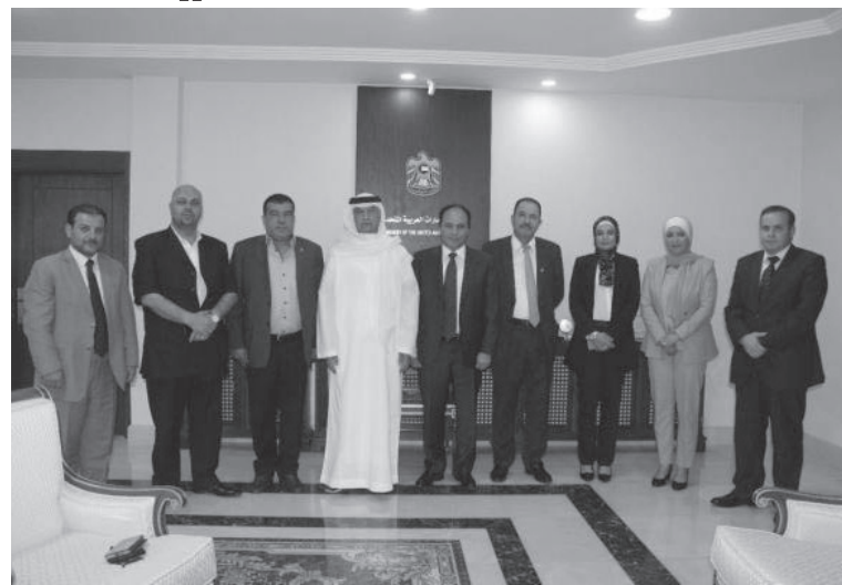
وتسهم في تقريب وجهات النظر والمواقف حيال العديد من التحديات والقضايا المشتركة. من جهته، أكد البلوشي عمق العلاقات الأخوية التي تجمع البلدين والشعبين

بحث رئيس وأعضاء لجنة الأخوة البرلمانية الأردنية مع دول الخليج العربي واليمن، مع السفير الإماراتي لدى المملكة، أحمد علي البلوشي، العلاقات الأخوية التي تربط عمان وأبو ظبي، وسبل تعزيزها في المجالات كافة، لاسيما البرلمانية منها.