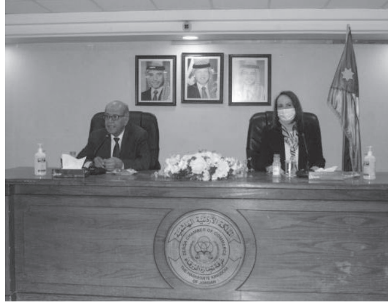
القطاعات الاقتصادية يهدف الى تحديد المشكلات التي تواجهها وإيجاد حلول تسهم في تحسين الوضع الاقتصادي. ودعا شريم إلى وضع آليات عمل تنعش

أكدت وزيرة الصناعة والتجارة والتموين الهندسة مها العلي، حرص الوزارة على دعم القطاع التجاري في محافظة الزرقاء وتعزيز تنافسيته ومساعدته على زيادة قدراته التصديرية الى الأسواق الخارجية. وأشارت الوزيرة خلال لقائها امس الأربعاء، رئيس وأعضاء مجلس إدارة غرفة تجارة الزرقاء، بدور القطاع التجاري في دعم الاقتصاد الوطني ومساهمته في رفع الناتج المحلي الإجمالي للمملكة وزيادة الصادرات التجارية. وأشارت الوزيرة الى أنه سيتم متابعة ودراسة جميع ملاحظات غرفة تجارة الزرقاء المقدمة خلال الزيارة بالتنسيق مع الجهات الحكومية المعنية. بدوره، أكد رئيس غرفة تجارة الزرقاء حسين شريم، ان التواصل الميداني مع