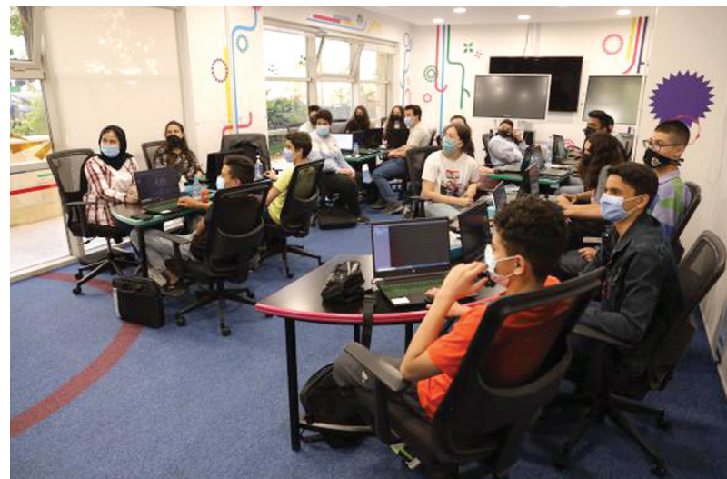
٢٠ طالبا وطالبة، دورات تدريبية مكثفة سيقدّمها مجموعة من المدرّبين في

وتحرص المنصة على اختيار المجالات التي من شأنها أن تعود بالفائدة على الطلاب المشاركين بالبرنامج بما يُسهم من تطوير شخصياتهم وصقلها، واكتساب مهارات جديدة تمكّنهم من تحديد توجهاتهم وميولهم على الصعيدين العملي والأكاديمي، بالإضافة إلى غرس مفهوم ريادة الأعمال والإبداع والابتكار لديهم منذ الصغر لبناء أجيال تصنع الفرص بدلا من انتظارها.