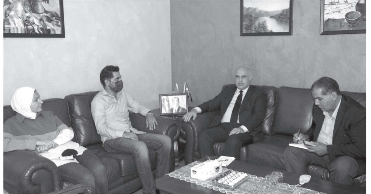
الانباط- نعمت الخورة

قرب احتفال البلدين في عام 2023 بمرور 30 عاما على العلاقات بين البلدين واشاد السفير بدور الاردن بقيادة جلالة الملك عبد الله الثاني بتحقيق السلام و الامن والاستقرار في المنطقة مشيرا في ذات الوقت الى اهمية دور الاردن في الوصاية الهاشمية على المقدسات الاسلامية والمسيحية في القدس . وحول العلاقات الاقتصادية بين البلدين اكد انها ما زالت اقل من المتوقع ولا تعكس متانة العلاقات السياسية بين البلدين وان السبب يعود لعدم الالم الطرفين باحتياجات كل طرف والعمل بالتعاون في توفيره . وفيما يخص الخط الجوي المباشر بين