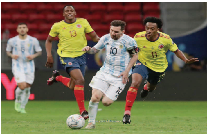
البرازيل - وكالات

ووصول مسيرته الكروية إلى فصلها الأخير، إذ يتوقع أن تكون بطولة كوبا أمريكا هذه هي الأخيرة لميسي مع الأرجنتين وتنتظر جماهير الأرجنتين بفارغ الصبر نتيج منتخبها بهذا اللقب الغائب عنها منذ سنة 1993 حين توجت بها على حساب المكسيك بهدفين مقابل واحد. ويدرك ميسي أن كل الضغوطات ستكون ملقاة على عاتقه للظفر باللقب، لأنه نجم المنتخب الأول ومن دون منازع. وأثبت ليونيل ميسي طيلة هذه السنوات قدرته الكبيرة على تحويل الضغوطات إلى فرصة لتحقيق الفوز، واعتلاء منصات التتويج إلا أن مهمة ميسي وباقى نجوم الأرجنتين لن تكون سهلة في مباراة النهائي أمام المنتخب البرازيلي القوي للغاية. وما يرفع من أسهم ليونيل ميسي في رفع كأس الكأس بعد أيام هو قوة تشكيلة المنتخب الأرجنتيني، التي تقع مجموعة من النجوم في مختلف المراكز (دي مازيا، مارتينيز...)، مما يمنح مدرب المنتخب ليونيل سالكوني عدة حلول تكتيكية فوق أرضية الملعب، ومفاجأة الخصوم بخطط غير متوقعة. كما أن انسجام ميسي مع نجوم منتخب «التانجو» واضح بشكل كبير، إذ أن نجوم المنتخب يلعبون بانسجامية ومرونة كبيرة. زيادة على روح الفريق والتضحية الكبيرة فوق الميدان من أجل تحقيق الانتصارات.