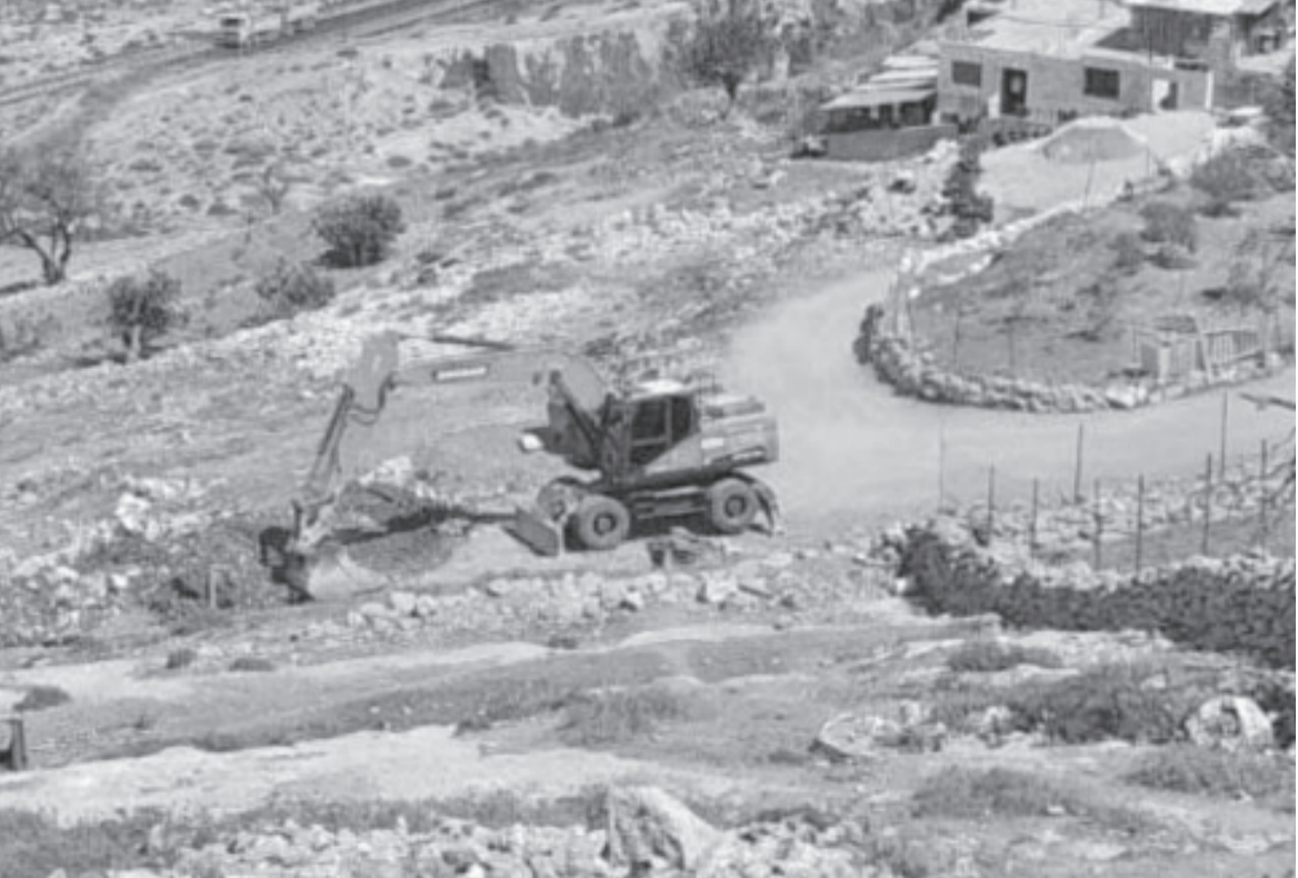
القدس المحتلة من الوجود الفلسطيني القدس المحتلة شمال خربة الحديدية بالأغوار الشمالية تمهيدا لإقامة بؤرة استيطانية

وأوضح التقرير أن قوات الاحتلال تواصل عمليات هدم ممتلكات الفلسطينيين في الضفة الغربية حيث هدمت منازل ومنشآت الفلسطينيين في قرية ابزيق في الأغوار الشمالية و١٦ منشأة تجارية في بلدة حزمًا بالقرب من القدس وثلاثة منازل في بلدة سعير بالخليل وخمس منشآت زراعية في وادي رحال في بيت لحم ومنشأة زراعية في بلدة سبسطية شمال نابلس وعدة منازل ومنشآت على طريق المرحات شمال رام الله فيما سلمت الخطارات بهدم منزلين في قرية الولجة في بيت لحم وعدة منازل في قرية النبي إلياس وجيت في قلقيلية وبين التقرير أن المستوطنين يواصلون اعتداءاتهم على مدن وبلدات الضفة الغربية بحماية قوات الاحتلال حيث اقتحموا قرية بورين وجالود جنوب نابلس واعتدوا على منازل وممتلكات الفلسطينيين كما ألقوا ١٤٠ غرسة زيتون في أراضي بلدة الخضراء جنوب مدينة بيت لحم وشقوا طريقاً استيطانياً على أراضي قرية كيسان شرق المدينة ومنعوا المزارعين الفلسطينيين من الوصول إلى أراضيهم في بلدي حارس وكفل حارس في سلفيت وجرّفوا مساحات من أراضي