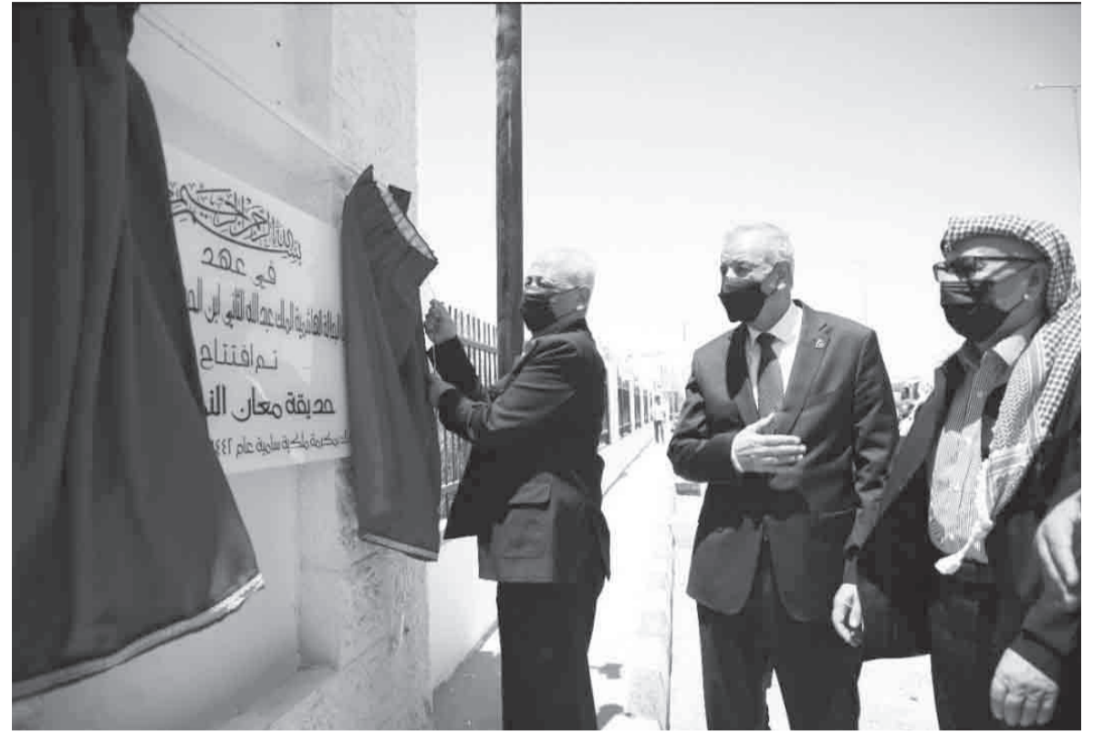
الانباط- الطفيلة ومعان

الشفافية التي تضعها وزارة التنمية الاجتماعية. كما افتتح العيسوي، في لواء الحسا، قاعة متعددة الأغراض بمساحة ٤٥٠ مترا مربعا، وتضم مكاتب ومرافق أخرى، لتكون مركزا لإقامة الأنشطة والفعاليات الثقافية لأهالي المنطقة، تستهدف تدريب وتأهيل أبناء المنطقة، لا سيما فئة الشباب، لتكون حاضنة للرياديين منهم، لاستثمار طاقاتهم وتفعيل مشاركتهم في الحياة العامة وخدمة مجتمعهم، تحقيقا لرؤى جلالة الملك الذي يولي الشباب جل اهتمامه ورعائيته، فضلا عن تمكين المؤسسات المجتمعية والتطوعية لتعزيز دورها في خدمة المجتمعات المحلية، كما يمكن استخدامها في المناسبات الاجتماعية لأبناء المنطقة. ويشتمل الطابق الثاني من مبنى القاعة على مقر دائم لكاتب لبلدية الحسا، ليكون نواة للنهوض بالواقع الخدمي والتنموي في منطقة الحسا بجهد تشاركي مع أفراد المجتمع كافة. وفي معان، افتتح العيسوي، أكبر حديقة ومنزرة في المحافظة، والتي تقع على مساحة ٢٢ دونما، لتكون منتصفا للعائلات، إذ تتميز بالمسطحات الخضراء والأشجار، وتتضمن على مناطق مخصصة لألعاب الأطفال وملعب كرة