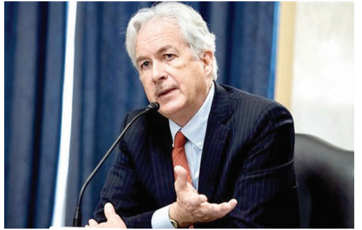
الانباط - وكالات

الأميركي سيلتقي الرئيس ورئيس وزراء الاحتلال الإسرائيلي نفتالي بينيت، وكذلك الرئيس الجديد لجهاز الاستخبارات الخارجية الإسرائيلي (الموساد)، للبحث في برنامج إيران النووي وأنشطة إيران في المنطقة، وفي رام الله، أكد مسؤول فلسطيني أن وليام بيرنز سيلتقي الرئيس محمود عباس