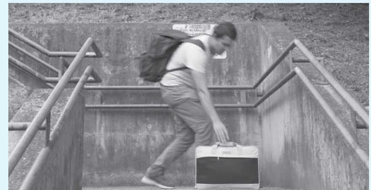
تدهور الوضع الأمني هناك يأتي هذا بعدما دعت حكومة كابول في يوليو الدول الأوروبية إلى وقف ترحيل المهاجرين الأفغان للأشهر الثلاثة المقبلة. وعلقت السويد وهولندا عمليات الترحيل إلى أفغانستان عقب هذه الدعوة

رفضت طلبات اللجوء التي تقدموا بها، إلى بلادهم من قبل السلطات الألمانية خاصة في عامي 2018 و2019 من جهتها، قالت وزيرة الدولة الهولندية للعدل والأمن أنكي بروكزوتون "من المرجح أن يتغير الوضع في أفغانستان والأحداث في الفترة المقبلة غير متوقعة لدرجة أنني قررت تعليق لفترة قرارات الطرد والترحيل" وأضافت وزيرة الحزب الليبرالي في رسالة إلى البرلمان الهولندي: "يسري تعليق قرارات الترحيل لمدة ستة أشهر وتطبق على الرعايا الأجانب من الجنسية الأفغانية" بدورها قالت متحدثة باسم وزارة الداخلية الفرنسية الخمسين إن فرنسا أوقفت ترحيل المهاجرين إلى أفغانستان في أوائل يوليو بسبب