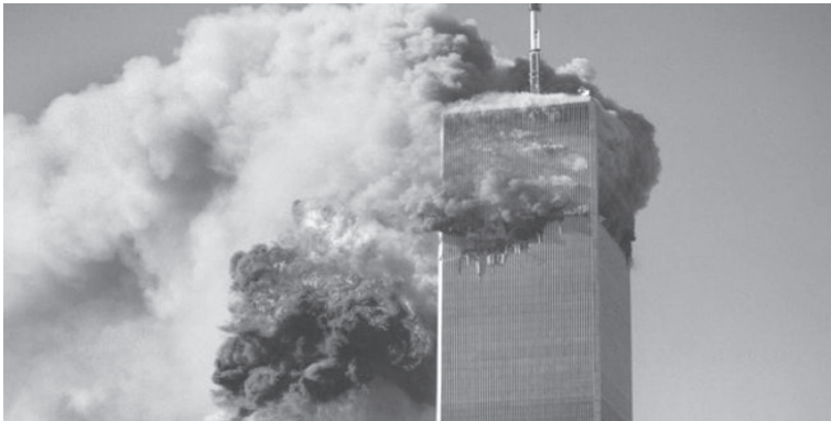
لتأثيرات متطرفة عنيفة وتنتشر وزارة الأمن الداخلي الأمريكية التي أنشئت بعد هجمات الـ11 من أيلول تحذيرات من هذا النوع بانتظام وكانت مذكرة صدرت في أيار الماضي تحذرت من خطر استغلال متطرفين رفح

حذرت الحكومة الأمريكية مجدداً من أجواء حادة لتهديد إرهابي وذلك مع اقتراب موعد الذكرى العشرين لهجمات الحادي عشر من أيلول 2001 في الولايات المتحدة ونقلت وكالة الصحافة الفرنسية عن وزارة الأمن الداخلي الأمريكية قولها في مذكرة لها إنه قبيل ذكرى اعتداءات الحادي عشر من أيلول نشر تنظيم القاعدة مؤخرًا أول نسخة باللغة الإنكليزية منذ أربع سنوات من مجلته الداعمية إنسباير وذلك يدل على أن المنظمات الإرهابية الأجنبية تواصل جهودها لتلقي عثماني أفراد متمركزين في الولايات المتحدة وقد يكونون عرضة