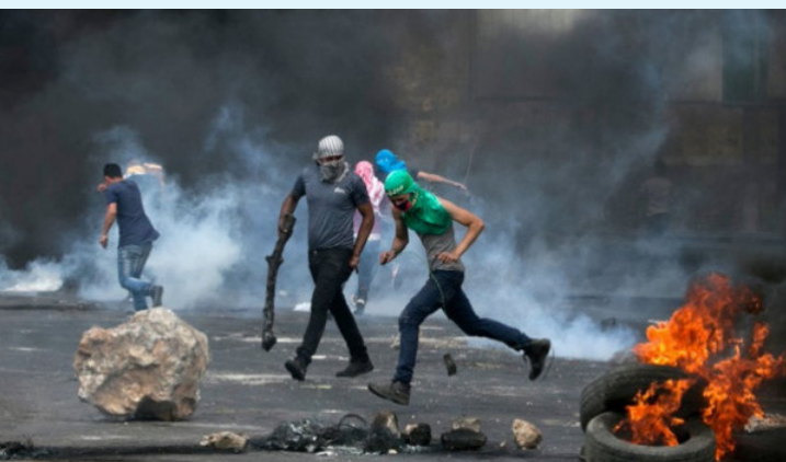
إلقاء زجاجات حارقة على دوريات الاحتلال ومركبات مستوطنية