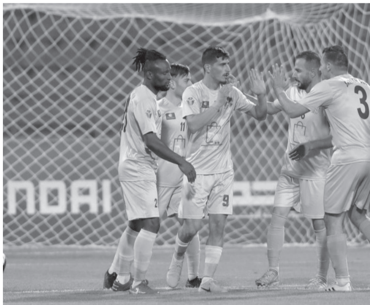
الانباط - عمان

جاهدا للعودة إلى مصاف أندية المحترفين. وأضاف: الدعم الذي تحصل عليه أندية