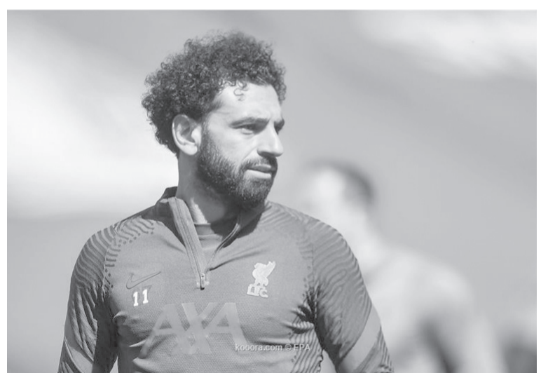
لندن - وكالات

في تغريدته: "أتمنى أن يشاهدوا"، مما يشير إلى أن عرض ليفربول على صلاح للتجديد لا يليق به. وأعلن ليفربول مؤخراً تجديد عقود كلاً من فيرجيل فان دايك وترينت ألكسندر أرنولد وأليسون وفابيو، من أجل الحفاظ على العناصر الأساسية واستقرار الفريق. وأضافت الصحيفة أن ليفربول يرغب في الإبقاء على صلاح، كما يرحب اللاعب بالتجديد، لكن لا يوجد اتفاق حتى الآن. ومع ذلك، فلا يوجد قلق داخل ليفربول بشأن تجديد عقد صلاح، وسيتم التوصل لاتفاق قريباً بشأن الراتب الذي يليق بما يقدمه اللاعب.