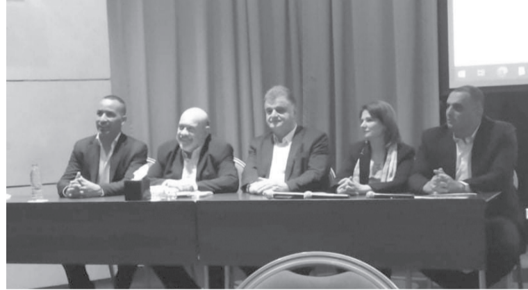
النهوض بالحوار الاجتماعي في بلدان جنوب المتوسط (SOLiD)، وفعالياته المختلفة. وأكد المعايطة، التزام الاتحاد العربي للنقابات بنهج الحوار الاجتماعي بوصفه