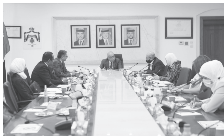
بها الوزارة، بما ينسجم مع رؤى وتطلعات قيادتي البلدين الشقيقين.