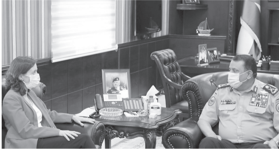
والشرطية وبما يسهم في خدمة البلدين الصديقين.