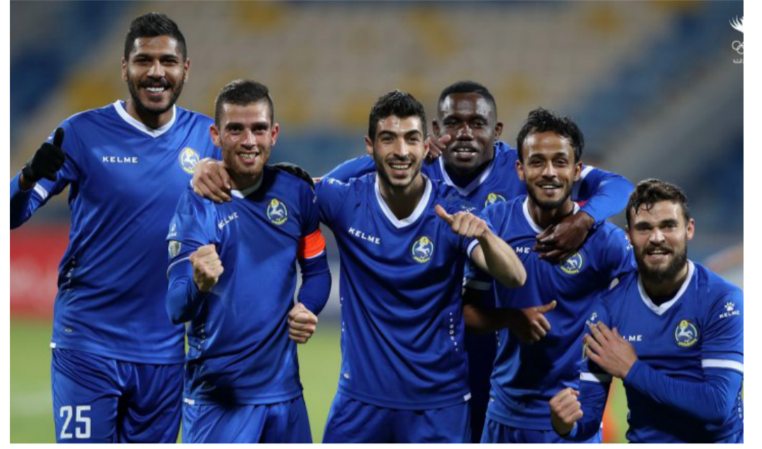
الانباط - معان

السادسة مساءً وفي المباراة الثانية يستضيف فريق معان فريق الفيصلي على ملعب الأمير محمد في الزرقاء في الساعة الثامنة والنصف مساءً وفي اللقاء الأخير يستضيف شباب الأردن فريق البقعة على ملعب ستاد عمان الدولي في الساعة الثامنة والنصف مساءً... في اللقاء الأول يسعى