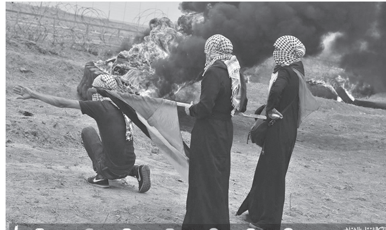
طويلة تاريخياً لم يسبق إليها أحد

أهم ما قيل عن عدوان مايو الماضي كان على لسان "أفيدور ليرمان" الوزير الحالي في حكومة "بينيت" أنها معركة خاسرة دون أهداف ومرتبطة بشخص "نتياهو" فقط ويرى اللواء يوسف شرقاوي الخبير العسكري أن بحثاً معمقاً جرى عقب عدوان مايو تستر فيه الاحتلال على إخفاقاته بعد أن ردت المقاومة بقوة ودقة لأهداف استراتيجية تحولت معها مدينة عسقلان لمدينة أشباح مدمرة ويتابع لـ"المركز الفلسطيني للإعلام": "فشلت إسرائيل في تصفية مترو أنفاق المقاومة واستدراجها في مناورة شمال غزة واستخدام ٦٠-١٦٠ طائرة لم توقف الصواريخ وبقيت غزة حالة معقدة" المشهد الصراع داخل الدولة بين الحكومة والمعارضة