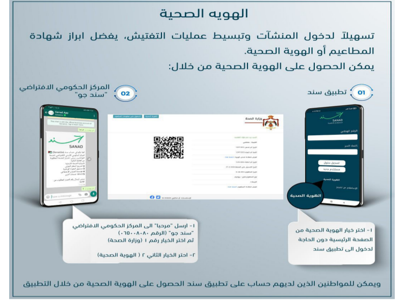
ويمكن للمواطنين الذين لديهم حساب على تطبيق سند الحصول على الهوية الصحية من خلال التطبيق

قالت وزارة الاقتصاد الرقمي والريادة، إنه بإمكان المواطنين الراغبين بالحصول على الرمز الخاص بألية التفتيش ويواجهون مشكلة في الدخول إلى تطبيق سند، استخدام خيار الهوية الصحية على صفحة التطبيق الرئيسية دون الحاجة للدخول للتطبيق حيث سيتم تزويدهم