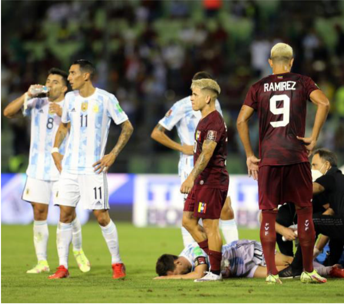
الأرجنتين - وكالات

جونزاليس إظهار البطاقة الصفراء، لكن بعد مراجعة تقنية الفيديو عاد لإظهار البطاقة الحمراء المباشرة. وبحسب قناة "Tyc"، الأرجنتينية، فإن ميسي عانى من جرح أسفل الركبة، لكن لحسن حظه كان الجرح سطحي، وربما هذا التدخل كان سيسبب للبرغوث المزيد من التعقيدات، وواصل ميسي المباراة بأكملها بعدما تلقى العلاج في الدقيقة ٢٥، تدخل بقوة على ركبة ميسي، وقرر حكم المباراة ليودان