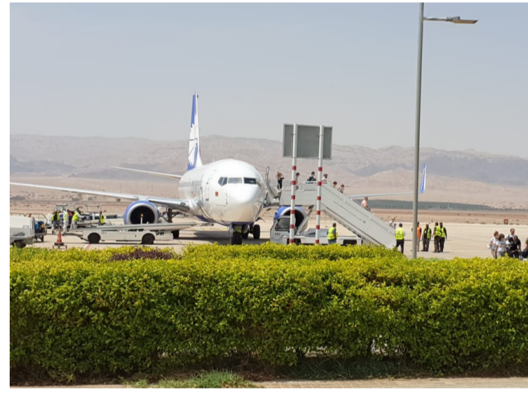
بروتوكولات وسائل الوقاية الصحية. بدوره، مدير هيئة تنشيط السياحة

حطت في مطار الملك الحسين الدولي في العقبة، امس الجمعة، طائرة تقل ١٤٥ سائحا من روسيا البيضاء.