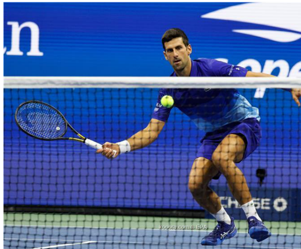
امريكا - وكالات

رقم ١٣ له في المباراة. وعقب فوزه على منافسين شابين، يواجه ديوكوفيتش في الدور الثالث الياباني كي نيشيكوري وصيف بطل أمريكا المفتوحة ٢٠١٤.