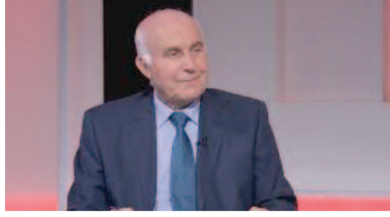
المستهدفة لأخذ مطعوم كورونا بالأردن هي من سن ١٨ عاما فما فوق، ما يشكل ٥٥٪

أكد أمين عام وزارة الصحة لشؤون الأوبئة مسؤول ملف كورونا الدكتور عادل البليسي، أنه وفقا للأرقام الوبائية المستقرة، فلا يتوقع حدوث موجة كورونا جديدة، وقال في حديثه لشاشة التلفزيون الأردني امس الخميس، أنه ومنذ انتهاء الموجة الثانية، هنالك أكثر من ٢٠ أسبوعا من استقرار الوضع الوبائي. وأشار إلى أنه وخلال الأسابيع الـ ١٤ الماضية ارتفعت أعداد الإصابات قليلا، ومن ثم تسطح المنحنى الوبائي، مضيفا "نتوقع ارتفاعا قليلا بأعداد الحالات لكن ليس على شكل موجة". وعن حملات التطعيم، أوضح أن الفئة