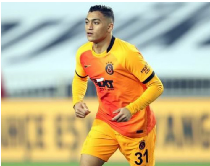
اسطنبول - وكالات

نشره موقع (fanatik)، عن رغبة المدرب فاتح تريم الفني لجالطة سراي التركي في التخلص من مصطفى محمد بنهاية الموسم. وأشار التقرير إلى أنه سيتم عقد اجتماع بين فاتح تريم ورئيس النادي بوراك أمانس لحسم مصير اللاعب المصري. وخاض مصطفى محمد، ٢٣ عاماً، ١٢ مباراة هذا الموسم مع جالطة سراي، لكنه لم يسجل أي هدف وصنع هدفاً واحداً لزميله.