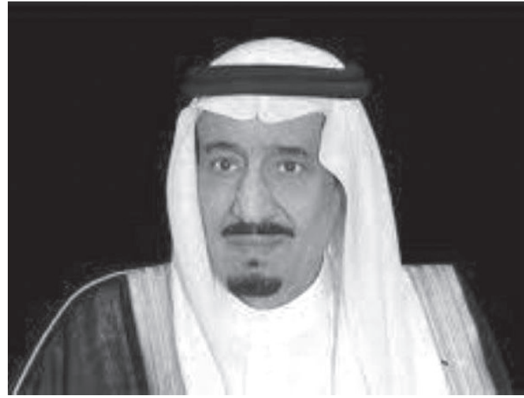
اللزامة لذلك، بحسب صحيفة الاقتصادية. تلك الهيئة، واستكمال الإجراءات

يأتي الأمر الملكي بإنشاء الهيئة بعد الاطلاع على ما عرضه ولي العهد نائب رئيس مجلس الوزراء ورئيس مجلس الشؤون الاقتصادية والتنمية، وبناء على ما تقتضيه المصلحة العامة. يجسد إنشاء هيئة تطوير ينبع وأملج والوجه وضياء اهتمام الأمير محمد بن سلمان ولي العهد نائب رئيس مجلس الوزراء وزير الدفاع، وحرصه على تطوير مختلف مناطق ومحافظات المملكة واستغلال المقومات الطبيعية والبيئات التنافسية ورفع جودة الحياة والبنى التحتية فيها.