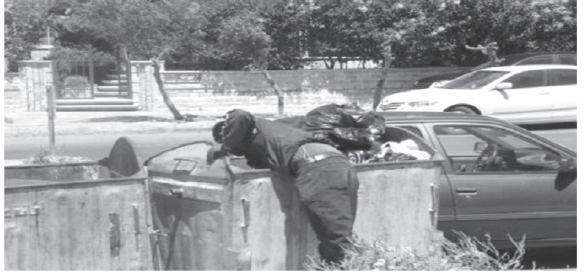
نزار البطينية - الأنباط

وجدت بسبب ما يترك بعدها من (الحاويات)، حيث أن الكثير ممن يمتن هذه المهنة يقوم بإخراج كل ما في (الحاويات) بهدف جمع الخردة وترك النفايات بجانب (الحاوية) بعد الانتهاء جمع ما يحتاجه منها، ويعاني المواطنون وأمانة عمان وعمال النظافة على حد سواء بشكل خاص يعانون من هذه الظاهرة، ولهذا يقومون بحملات نظافة لجميع المناطق، إلا أن جهودهم يذهب هباءا منثورا بسبب مثل هذه الأفعال التي أصبحت