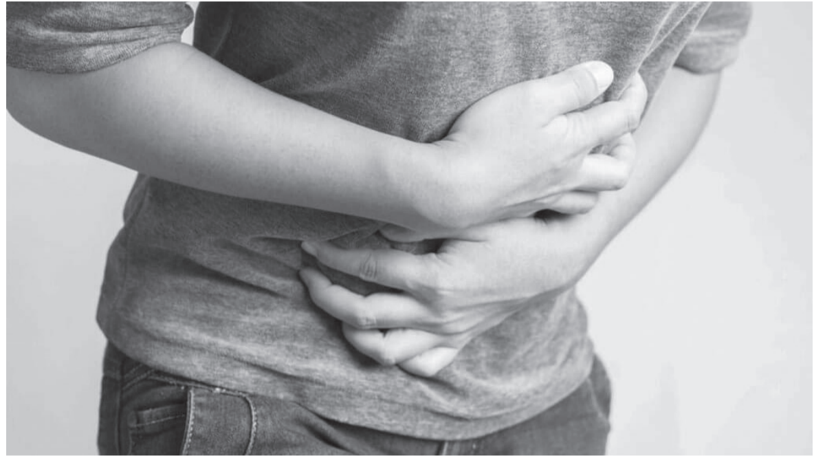
الأنباط - دلال عمر

الآن بأعراض (الحمى، الإسهال، والغث) وتطورت الأعراض عند بعض الأطفال الذين تعرضوا لحالات التشنج. وقال مستشار العلاج الدوائي السريري للأمراض المعدية الدكتور ضرار حسن بلعوي بأنه يوجد فرق بين التشخيص والتخمين، بحيث التشخيص يكون عن طريق أخذ السيرة المرضية خلال الأيام