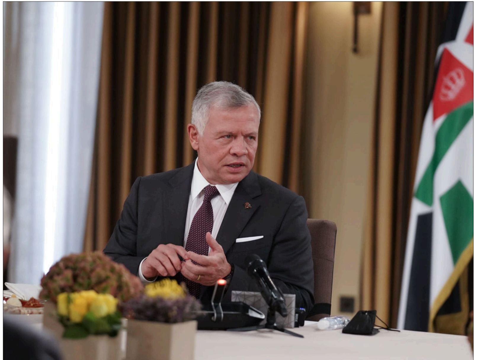
الانباط - لندن

التقى جلالة الملك عبدالله الثاني، امس الجمعة، عدداً من الشخصيات البرلمانية والأكاديمية والفكرية في لندن. وتناول اللقاء، الذي حضرته جلالة الملكة رانيا العبدالله،