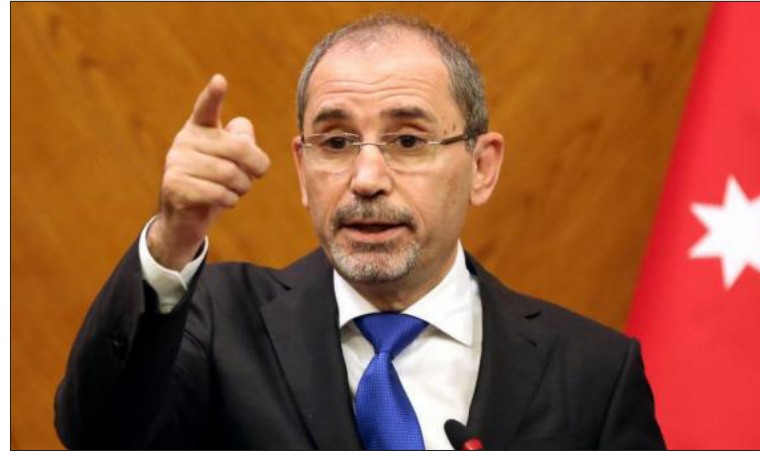
برئاسة الأردن والاتحاد الأوروبي، وباستضافة من إسبانيا، والمزمع عقده

في التاسع والعشرين من الشهر الجاري في برشلونة. كما أكد أهمية الاجتماع الوزاري، الذي سيعقد بعد ظهر نفس اليوم، لوزراء خارجية الاتحاد الأوروبي مع نظرائهم من دول الجوار الجنوبي الشريكة للاتحاد الأوروبي في إطار "وثيقة الاتحاد الأوروبي لسياسة الجوار الجنوبي".