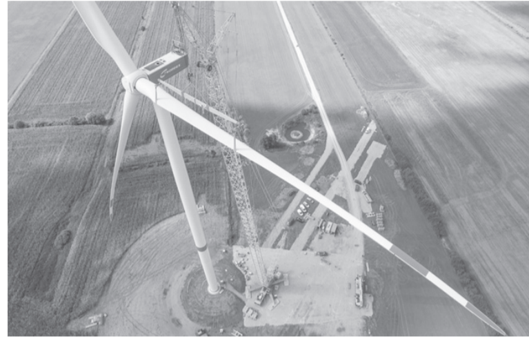
الاحتباس الحراري، فإن تركيب المزيد من المعدات الخاصة بمصادر

تتوقع البعض من أكبر الشركات المنتجة لتوربينات توليد الطاقة من الرياح في العالم عاماً صعباً آخر. ووفقاً لشركة فيستاس ويند سيستمز آيه/إس وسيمنس جاميسا رينيبول ، من المتوقع أن يستمر ارتفاع أسعار السلع الأساسية والعراقيل التي تواجه سلسلة التوريد في العام المقبل. وهذا يجعل من الصعب بشكل أكبر على نشاط صناعي يعد عاملاً رئيسياً في تحقيق أهداف العالم الخاصة بالمناخ، أن يحقق ربحاً. ووفقاً لوكالة بلومبرج، تأتي التحديات في وقت حرج. وبينما يجتمع قادة العالم في جلاسكو