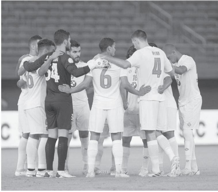
الكويت - وكالات

فقط)، مباراتين وديتين، الأولى يوم الأربعاء المقبل، مع الوحدة السعودي، والثانية أمام أهلي جدة يوم ١٤ من الشهر الجاري ويفتح الكويت، مبارياته في بطولة الدوري الكويتي هذا الموسم، بمواجهة اليرموك يوم ٢١ نوفمبر/تشرين ثان الجاري. يذكر أن نادي الكويت، خسر لقب الدوري الموسم الماضي، لصالح العربي الذي توج بالبطولة، فيما حقق الكويت المركز الثالث، خلف القادسية، الوصيف.