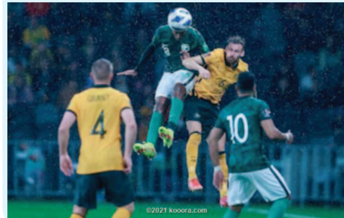
سيدني - وكالات

اقتنص المنتخب السعودي نقطة غالية من أسياب مستضيفه الأسترالي، بعد تعادلهما سلبياً، ظهر الخميس على ملعب كوميانك في سيدني، وسط أجواء ممطرة، في الجولة الخامسة من التصفيات المؤهلة إلى كأس العالم قطر ٢٠٢٢. وكان اللقاء سجلاً بين المنتخبين، حيث هدد الكانجرو مرمي السعودية في أكثر من فرصة على مدار الشوط الأول، بينما شهد الشوط الثاني تفوقاً واضحاً للصحور وأضاعوا أكثر من ٣ فرص محققة للفوز. وارتفع رصيد منتخب السعودية إلى ١٣ نقطة محافظاً على صدارة الترتيب في مجموعته، فيما ارتفع رصيد أستراليا إلى ١٠ نقاط في المركز الثاني.