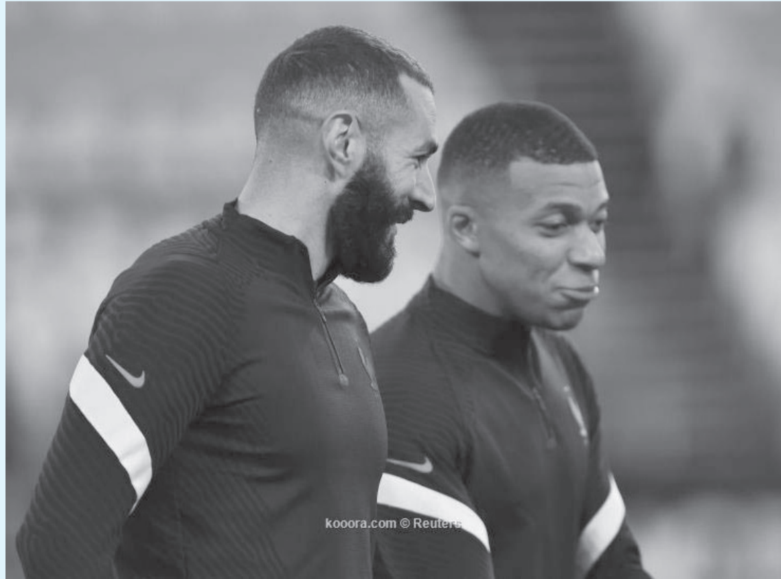
كويرا.كوم © Reuters

ينتظر ريال مدريد سوق انتقالات ساخناً خلال الصيف المقبل، حيث ارتبط العديد من اللاعبين الكبار بالتوقيع مع المرني في شهر يونيو/ حزيران المقبل. ووفقاً لبرنامج ”الشيرنجيتو، الإسباني، فإن ريال مدريد سيحاول التوقيع مع كيليان مبالي مهاجم باريس سان جيرمان وإيرلينج هالاند نجم بروسيا دورتموند معاً خلال الصيف المقبل. وأوضح البرنامج الإسباني أنه رغم خطة المرني لمطاردة هالاند، لكن لدى ريال مدريد اعتقاداً بأن المهاجم النرويجي سينقل إلى أحد أندية الدوري الإنجليزي الممتاز خلال الصيف المقبل. وذكر ”الشيرنجيتو“ أن كريم بنزيما مهاجم ريال مدريد ومبالي يعملان على ضم مواطنهما بول بوجبا، لاعب وسط مانشستر يونايتد، إلى المرني في الصيف المقبل. وسبق أن قالت العديد من التقارير إن العلاقة بين بنزيما ومبالي قوية للغاية، ويتحدثان كثيراً عن ريال مدريد أثناء التواجد معاً في معسكر منتخب فرنسا، وينتهي عقد بوجبا مع التشابطين الأحمر في الصيف المقبل، وارتبط اللاعب الفرنسي كثيراً بالتوقيع مع ريال مدريد.