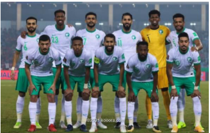
الرياض

وذلك بعد التنسيق مع الاتحاد السعودي لكرة القدم. وقال المصدر: "بات في حكم المؤكد غياب سلمان الفرج وسالم الدوسري، وسليمان الغنام وياسر الشهراني وعبد الإله العمري، وعبد الإله المالكي، عن بعثة المنتخب، وأوضح أن الأخضر سيشارك في كأس العرب "بمزيج من لاعبي المنتخب الأولمبي، وبعض لاعبي المنتخب الذين لم يشاركوا باستمرار خلال التصفيات المؤهلة للمونديال، جدير بالذكر أن المنتخب السعودي وقع في المجموعة الثالثة بكأس العرب، التي تضم بجانبه الأردن والمغرب وفلسطين.