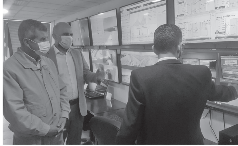
وقال ان لدى شركات القطاع المملوكة للحكومة الخبرة الكافية في مجال الطاقة المتجددة يمكن الاستفادة منها خاصة وان الأردن كان من أوائل الدول التي استثمرت

أكد وزير الطاقة والثروة المعدنية الدكتور صالح الخرابشة اليوم السبت، ضرورة الاخذ بالاعتبار التطورات التكنولوجية العالمية التي يشهدها قطاع الطاقة لتعزيز مساهمة المصادر المحلية في خليط الطاقة وتقليل الكلف التشغيلية. جاء ذلك خلال زيارة الى شركة السمرا لتوليد الكهرباء افتتح خلالها مركز المراقبة والتحكم في إدارة الشركة واستمع الى ايجاز حول سير العمل في الشركة التي تأسست عام 2004 ومملوكة بالكامل للحكومة. وأشار الوزير الخرابشة الى تطورات مهمة يشهدها قطاع الطاقة خاصة المتجددة وبالدات في مجال التخزين يمكن الاستفادة منها لاستناد جهود التوسع في مجال الطاقة المتجددة وحل ابرز التحديات التي تواجه القطاع حالياً ورفد الاقتصاد الوطني بقيمة مضافة عدا عن تقليل الكلف التشغيلية للقطاع.