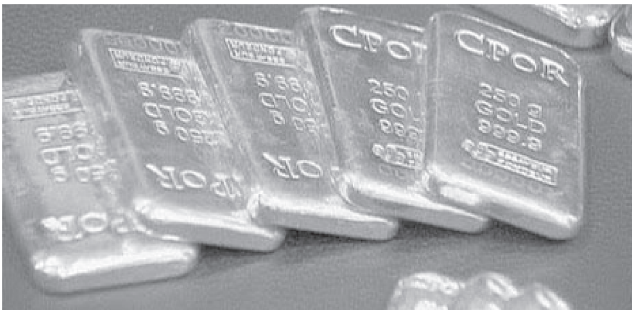
نيويورك - رويترز

للأوقية، كما هبط اليلاديوم 2.4 في المائة إلى 201,24 دولار ونزل البلاتين 1.8 في المائة إلى 1038,24 دولار المعدن النفيس، وبالنسبة للمعادن النفيسة الأخرى، تراجعت الفضة 0.6 في المائة إلى 24,33 دولار