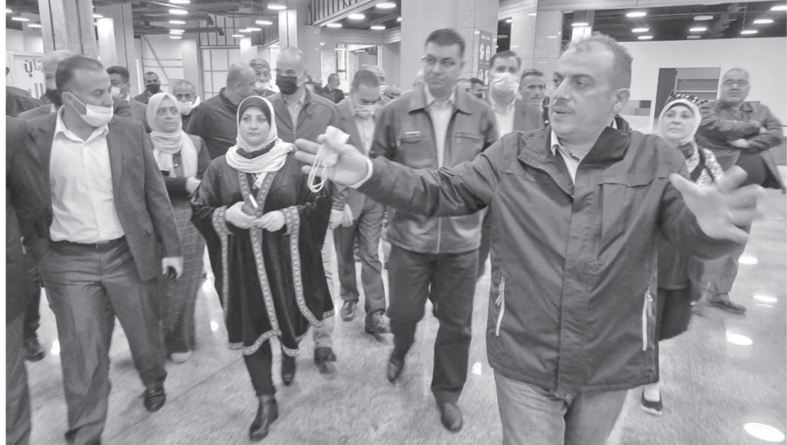
إلى البيع الوجاهي. وعلى صعيد تطبيق أوامر الدفاع على أرض المهرجان قال حداد أن المركز يعمل بشراكة في اللجان التحضيرية مع وزارة الصحة ومركز إدارة الأزمات لضمان التباعد الاجتماعي