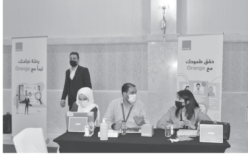
رقمي رائد ومسؤول. وخلال المعرض تواصلت أورنج الأردن مع الباحثين عن

وغيرها من المعلومات، مؤكدة على أهمية هذا المعرض، كونه يفتح المجال للتواصل ما بين الأشخاص ذوي الإعاقة والموظفين بشكل مباشر من كبرى الشركات ولاهتة إلى التزامها بالبحث عن الطاقات المبدعة التي يمكنها التميز والتقدم بما يتماشى مع مكانة الشركة الرائدة لدعم الشباب وتقديم فرص العمل والتدريب. وبينت الشركة أنها تولي اهتماماً كبيراً بتعزيز فرص الشباب الوظيفية والعلبية في المملكة، لحد من معدلات البطالة وتمكينهم من المساهمة بشكل فاعل في التنمية الاقتصادية والاجتماعية سواء من خلال الدعم الريادي أو التعليم أو التدريب، وذلك ضمن استراتيجيتها للمسؤولية الاجتماعية.