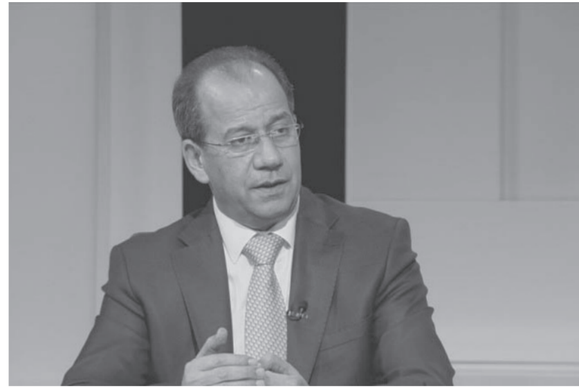
القطاعين العام والخاص؛ وذلك اعتباراً من مطلع العام الجديد ٢٠٢٢. وبين أن رئيس الوزراء أوعز خلال الجلسة إلى الجهات المختصة بتشديد الرقابة

عقد مجلس الوزراء، مساء اليوم الأحد، جلسة برئاسة رئيس الوزراء الدكتور بشر الخصاونة ناقش خلالها توصيات اللجنة الإطارية للتعامل مع وباء كورونا المتعلقة بتطورات الحالة الوبائية في المملكة. وأعلن وزير الدولة لشؤون الإعلام، الشبول أنه سيصدر خلال الأيام القليلة المقبلة أمر دفاع جديد، بموجب قانون الدفاع رقم (١٣) لسنة ١٩٩٢، لمواجهة الحالة الوبائية التي تشهد تصاعداً في الآونة الأخيرة. وأوضح الشبول في تصريحات أن أمر الدفاع الجديد سيتضمن مجموعة من الإجراءات، من ضمنها اعتماد شهادة مطعوم كورونا (جرعتان) كشرط وحيد للعاملين ومراجعي جميع الدوائر الرسمية، ومنشآت