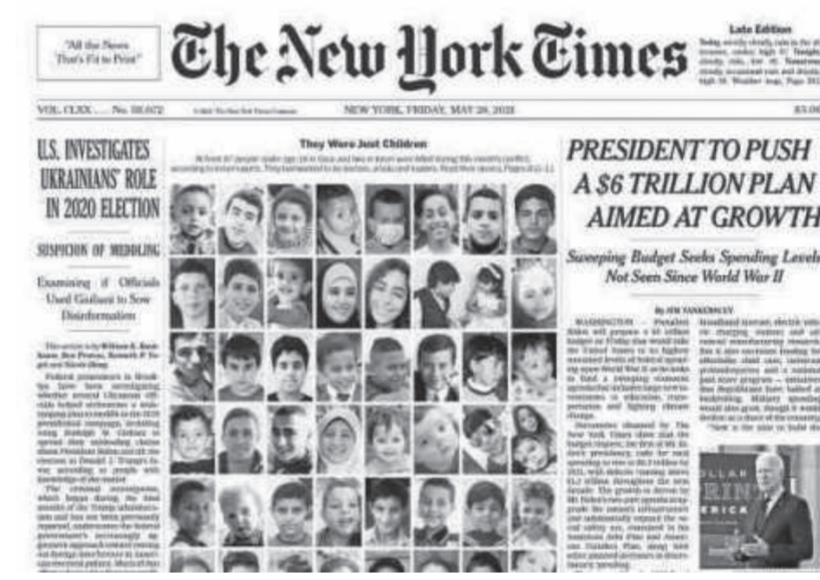
ولفت التقرير إلى أن الطفل الفلسطيني

يعد هدفاً رئيساً لممارسات الاحتلال اليومية من خلال عمليات القتل والاعتقال والتعذيب واقتحام المنازل والمرافق التعليمية، رغم كونه من الفئات المحمية بموجب القوانين والأعراف الدولية، مشيراً إلى أن قوات الاحتلال تلجأ إلى القوة المميته المتعمدة في ظروف لا يبررها القانون الدولي، وأن استخدام المفرط للقوة هو القاعدة عندها، مستغلة حالة الإفلات المنهج من العقاب وعدم المسائلة وأوضح: بموجب القانون الدولي، لا يمكن تبرير القوة المميته المتعمدة إلا في الظروف التي يوجد فيها تهديد مباشر للحياة أو إصابة خطيرة، ومع ذلك فإن التحقيقات والأدلة التي جمعتها الحركة العالمية للدفاع عن الأطفال، تشير بانتظام إلى أن قوات الاحتلال تستخدم القوة المميته ضد الأطفال الفلسطينيين في ظروف قد ترقى إلى القتل خارج نطاق الإهراء أو القتل العمد ، كما أكد تقرير الحركة العالمية للدفاع عن الأطفال