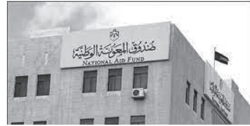
وأضاف التقرير أن عدد زيارات التحقق الميداني لأسر برنامج المعونات المالية (المعونة التكميلية) بلغ 1280 زيارة. وفيما يتعلق ببرنامج الدفع الإلكتروني، أوضح التقرير أنه تم تحويل المعونة المالية الشهرية المتكررة والمؤقتة بقيمة 8238768 ديناراً.

بلغ عدد الأسر الجديدة المشمولة ببرنامج المعونة المالية الشهرية المتكررة في صندوق المعونة الوطنية 1280 أسرة في شهر تشرين الأول. وذكر تقرير أعمال الصندوق لشهر تشرين الأول الماضي، أنه جرى إيقاف المعونة الشهرية المتكررة عن 1190 أسرة، وتم تخفيضها عن 87 أسرة، فيما بلغ عدد الحالات التابعة للبرنامج التي جرى مسحها 3905 أسر. وأشار التقرير إلى أن 778 أسرة جديدة استفادت من برنامج المعونات المالية الطارئة (العادية والفورية) و129 أسرة جديدة استفادت من برنامج التأهيل الجسماني، و11 أسرة من برنامج دعم برامج التدريب المهني لأبناء الأسر المنتجة.