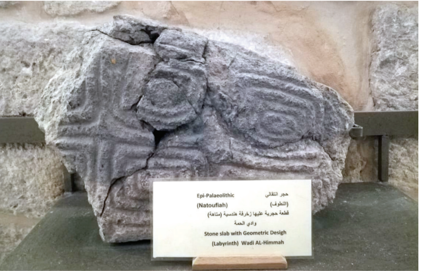
حجر التقلبي (التطوف) قطعة حجرية عليها زخرفة هندسية (مناهل) وادي الحمة Epi-Palaeolithic (Natoufiah) Stone slab with Geometric Design (Labyrinth) Wadi AL-Himmah

وأشارت أن متحف دار السرايا يضم مجموعة من القطع الأثرية التي تم اكتشافها من خلال حفريات محلية وأجنبية للمواقع الأثرية في محافظة أربد كالتقطع الفخارية والمعدنية والعملات حيث هناك تنوع في عرض القطع الأثرية من العصور القديمة إلى الكلاسيكي والفتريات الإسلامية، ويتألف من سبع قاعات ثلاثة قاعات كبرى (القديمة، الكلاسيكية والإسلامية) وتغطي بداية النشاط الإنساني قبل حوالي مليون سنة وتنتهي بالفترة العثمانية كالأباريق، الفواير الزجاجية، والأقفور الصغيرة والكبرى، والجرار المزخرفة والمزججة، وثلاثة قاعات متخصصة بالتمدين والمنحوتات والفسيفساء، ففي قاعة التمدين تعرض معروضات حديدية وبرونزية وأهمها العقد البرونزي الذي عمر عليه في طبقة فحل وتعود إلى العصر البرونزي ومنشأخان من الطين استخدمت في تعدين الحديد ويعود إلى الفترة الملكية، أما في قاعة المنحوتات تضم تماثيل الآلهة والأباطرة والأعيان تعود إلى الفترة اليونانية والرومانية، بينما تضم قاعة الفسيفساء لوحات كاملة لمواضيع مختلفة من الحياة كالريف والصيد بالإضافة إلى الزخرفة النباتية والحيوانية، وقاعة أربد التي تظهر ما بين الماضي والحاضر وتعرض مواضيع له علاقة بالآثار الأثرية وتعرف بالتاريخ الحضاري لمحافظة أربد، وساحة مكشوفة تضم مجموعة من القطع الكبيرة الحجم مثل التوابيت والأعمدة والأبواب والتيجان والمعاصر والمنحوتات التي تعود إلى الفترة الرومانية. بالإضافة إلى أنه تم استغلال هذه الساحة في إقامة الفعاليات المحلية من معارض، وبيارات، ومحاضرات، وحفلات موسيقية، وذلك لربط المجتمع المحلي مع المتحف.