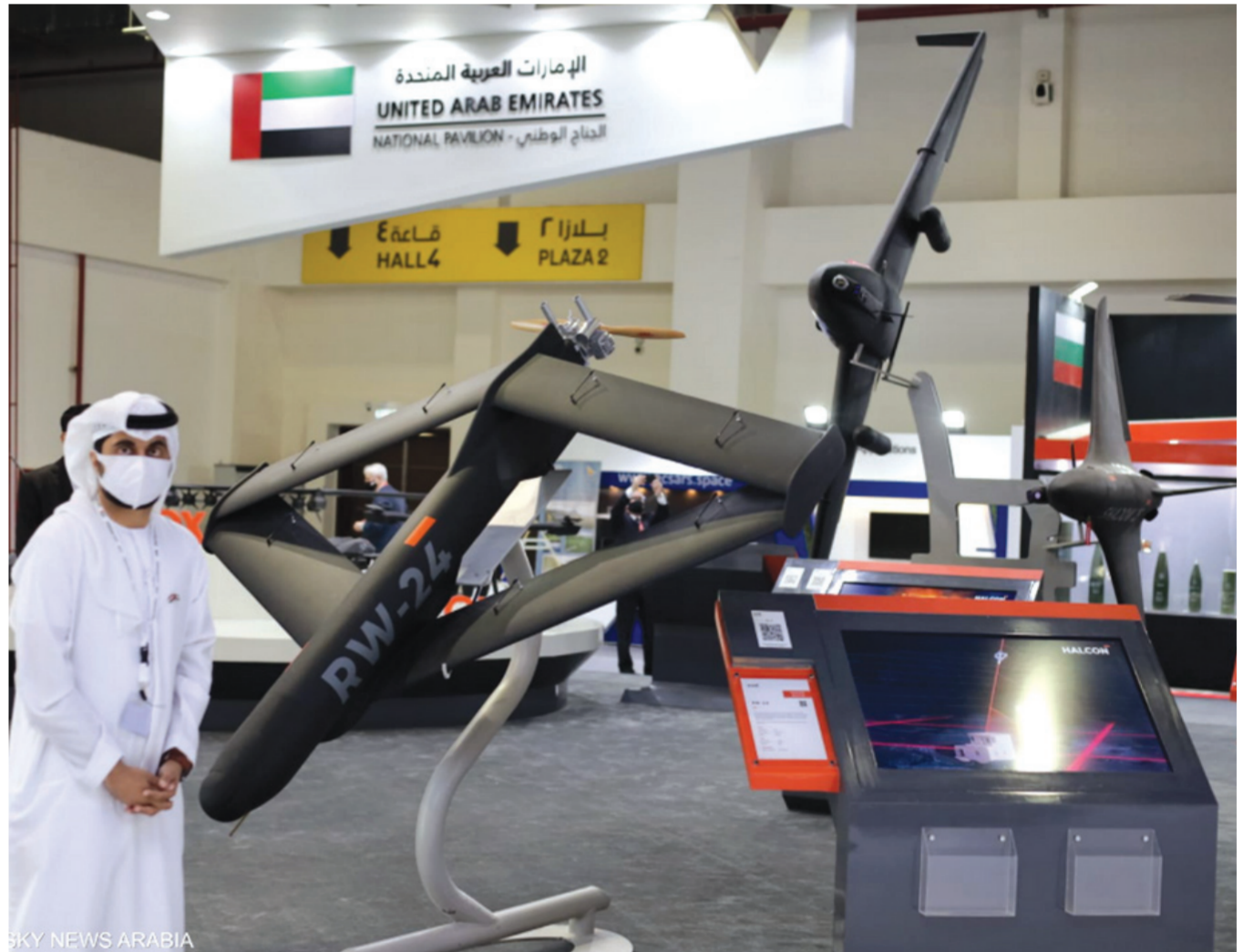
sky news arabia

وشدد على أن مشاركة «الجناح الإماراتي»، تضاعفت هذا العام، قياساً بالنسخة الأولى من المعرض (إيديكس 2018،) معرباً عن «فخره بالمعدات الإماراتية المشاركة، مؤمناً الأكثر تطوراً هذا العام..»