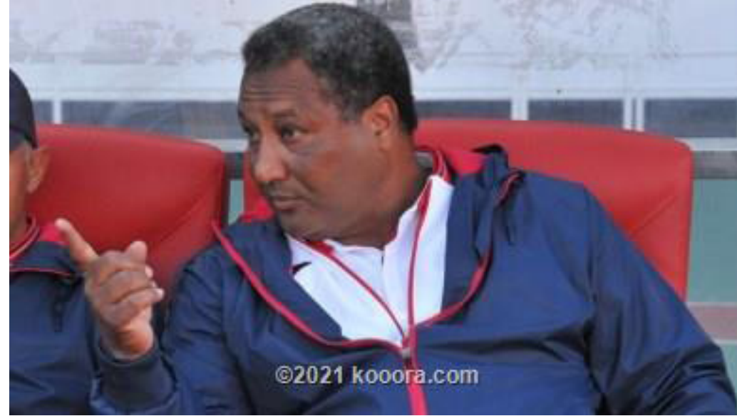
الدوحة - وكالات