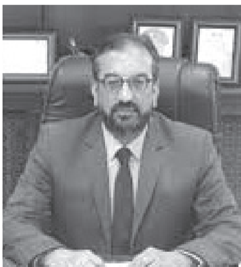
التابعة من قبل كوادر ذات خبرة سابقة وطويلة لوصوله

وحول ذلك، قال مدير الارصاد الجوية راند آل خطاب، ان علم الارصاد الجوية علم يدرس بالجامعات ويتم تهيأته بالدورات الجوية والعملية ليست سهلة . واضاف لـ«الأنباط»، أن اي شخص يتم تعيينه في الارصاد الجوية يتم على اسس ومراحل لا يمكن له العمل او التنبؤ دون تخطيها وبالإضافة إلى ذلك عليه اخذ دورة راصد جوي ومدتها 3 شهور، و دورة التنبؤ الجوي ومدتها 4 شهور ، ويجب اجتيازهم الامتحانات والدورات بنجاح، ومن ثم يبقى تحت