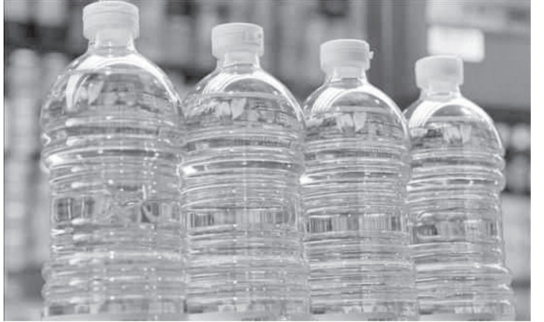
الأنباط - نور حاتملة

سبيل المثال لا الحصر، شهدت أسعار الشحن البحري من الصين الى الأردن ارتفاعاً غير متوقع من حوالي 2.000 دولار للوحادية الواحدة 40 قدم - قبل الجائحة- إلى ما يزيد عن 10.000 دولار (من غير الرسوم الجمركية المترتبة عليها)، نتيجة ما فرضته الجائحة على قطاع النقل والشحن. وعلى مستوى المواد الأولية، قال شهدت العديد من المواد الخام ارتفاعاً كبيراً بعد بداية جائحة كورونا، ومنها ارتفاع أسعار المواد الأولية للصناعات الغذائية، وتحديدًا الزيوت النباتية، بنسب تجاوزت الضعف مقارنة مع أسعارها قبل الجائحة، وارتفاع أسعار مواد التعبئة والتغليف عالمياً بأكثر من 35% مقارنة مع أسعار ما قبل الجائحة، كما ارتفعت أسعار الوقود الصناعي بما يزيد عن نسبة 17% مقارنة بما كان عليه سابقاً، مما أثر بشكل سلبي على كلف الإنتاج وارتفاع الكلفة بناء عليه، هذا بالإضافة إلى ارتفاع المواد الخام للصناعات البلاستيكية بنسب تتراوح ما بين 40%-30 مقارنة بأسعار ما قبل الجائحة، وكلها ذات صلة بالإنتاج المحلي وأسعار المنتجات في السوق المحلي. وأكد الجبجبر بأن مشكلة ارتفاع أسعار السلع الأساسية باتت تؤرق الاقتصاد الأردني بشكل ملحوظ خلال الفترة الماضية، ويكامل أطرافه من منتج ومصنع مروراً بالمورد والتجار وانتهاءً بالمشترك، ليؤثر ذلك على الطلب المحلي الذي يعاني بالأصل من تراجع واضح مقارنة بالسنوات الماضية أو بالأدق بعد جائحة