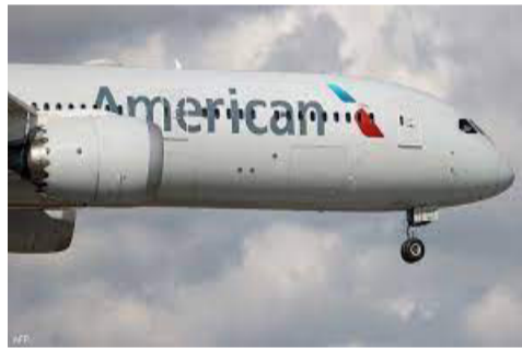
غيرت مجرى التاريخ.

وأوضحت "يوناييتد إيرلاينز" في بيان أن الراكب "تم يكن ممثلاً للتعليمات الفدرالية بوضع كمامة"، مضيفة: "نحن متنتون لطاقمنا لمعالجته المشكلة على الأرض قبل الإقلاع، وتجنب أي اضطراب محتمل في الجو."