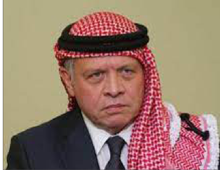
وبعث ولي العهد السعودي الأمير