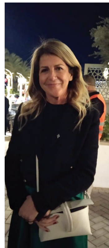
الانباط- العقبة - نعمت الخورة

● مشروع الراحة، مجتمع سكني مغلق على امتداد الشاطئ الجنوبي ● سرايا الشاطئ •• فلل وشقق فخمة وبرك سباحة ونادي رياضي