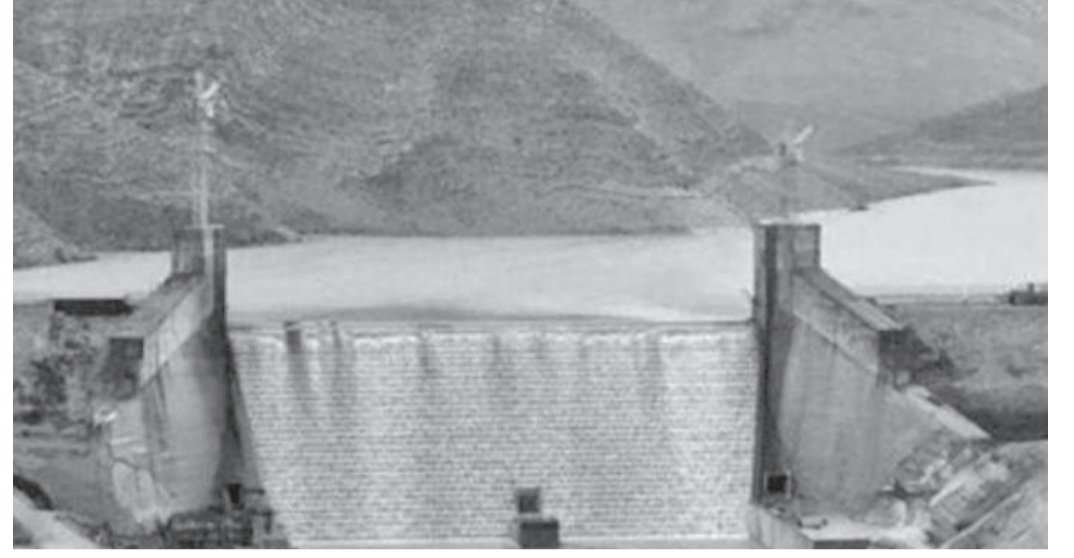
الانباط - سالي الصبيحات

حيازات كبيرة بمناطق بعيدة عن مصادر المياه يعمل حفائر وسدود تريبية لاستغلال المياه.