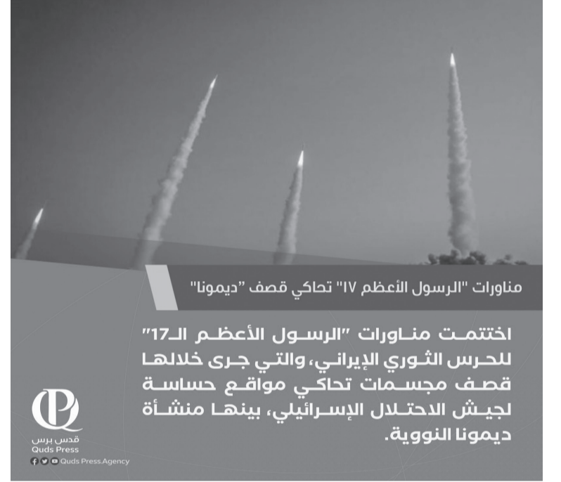
مناورات "الرسول الأعظم ١٧" تحاكي قصف "ديمونا" اختتمت مناورات "الرسول الأعظم ١٧" للحرس الثوري الإيراني، والتي جرى خلالها قصف مجسمات تحاكي مواقع حساسة لجيش الاحتلال الإسرائيلي، بينها منشأة ديمونا النووية.

وتقول إيران إن صواريخها الباليستية يبلغ مداها ألفي كيلومتر وقادرة على الوصول إلى "إسرائيل" والقواعد الأمريكية في المنطقة وجنات المناورات الإيرانية، التي أجراها الحرس الثوري، في وقت يوجه فيه مسؤولون إيرانيون تهديدات متكررة لطهران على خلفية برنامجها النووي، والمفاوضات الرامية إلى إحياء الاتفاق النووي المبرم بشأنه.