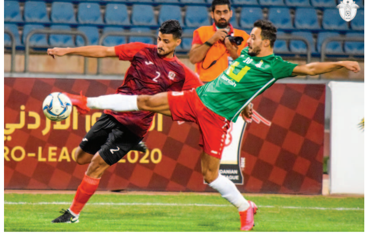
الانباط - عمان

بداية التوقف الدولي الأول للمنتخبات في 20 من الشهر ذاته، على أن تقام مباراة كأس السوبر والتي تجمع الرمثا والفيصلي مطلع نيسان القادم. وينطلق الدوري الأردني للمحترفين في الثامن من نيسان، ويستمر حتى 29 تشرين الأول، فيما تقام بطولة كأس الأردن ابتداءً من 22 تموز بمشاركة أندية المحترفين والدرجتين الأولى والثانية، على أن يشهد 11 تشرين الثاني المباراة النهائية لبطولة. في المقابل، ينطلق دوري الدرجة الأولى في 22 تموز وحتى 6 تشرين الثاني، والدرجة الثانية في 5 آب ولغاية 21 تشرين الأول، بعد دوري الثالثة الذي يبدأ في الأول من حزيران وحتى 30 تموز وعلى مستوى الفئات العمرية، يقام دوري (19) لختلف الدرجات وبطولة النخبة خلال الفترة من 5 حزيران ولغاية 24 تشرين الثاني، فيما يبدأ دوري (17 ت) يوم 17 حزيران وحتى 11 تشرين الثاني، فيما تنطلق بطولة (ت) (15) في 24 حزيران إلى 18 تشرين الثاني، على أن تشهد الفترة من 23 حزيران ولغاية 31 آب، بطولة الواعدين (ت) (13) ضمن مبادرة التصدي المستدامة. وتبدأ فترة التسجيل الأولى من 16 الشهر المقبل وتستمر حتى 21 آذار، على أن تقام الفترة الثانية من 10 إلى 27 تموز. وتختتم كافة بطولات الرجال قبل انطلاق كأس العالم 2022 في قطر، وفقاً لتعليمات الاتحاد الدولي «فيفا». وعلى صعيد البطولات النسوية، يبدأ دوري المحترفات في الثاني من حزيران، وحتى 28 تشرين الأول، فيما يقام كأس الأردن من 3 تشرين الثاني ولغاية مطلع كانون الأول.