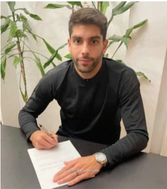
بيروت - وكالات

خوض الاستحقاقات الآسيوية. وبدأ سيجاح مشواره الكروي مع ناشئي ريال مدريد وخيتافي، قبل أن ينتقل للعب في جامعات أمريكا، ليحترف بعدها مع أندية عدة في الدوري الأمريكي. كما كانت له تجارب مع أندية عدة في إسبانيا وإيطاليا وكذلك مع نادي خيطان الكويتي، وواقع أيضاً عن ألقاب منتخب الأردن في ثلاث مناسبات.