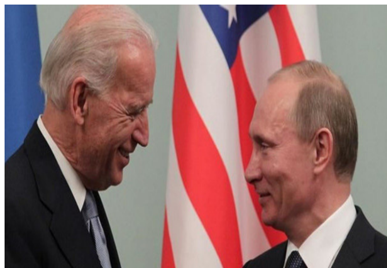
”مرتاحا“ بشكل عام للاتصال، صرح مسؤول أمريكي رفيع بأن النبرة كانت

حذر الرئيس الأمريكي جو بايدن، نظيره الروسي فلاديمير بوتين من رد قوي للولايات المتحدة على أي غزو لأوكرانيا، فيما اعتبر الزعيم الروسي أن فرض عقوبات ضد موسكو سيكون ”خطأ جسيما..“ وأصر مكالمة هاتفية بينهما استمرت ٥٠ دقيقة هي الثانية في غضون ثلاثة أسابيع، أشار الرئيسان إلى دعمهما للمسار الدبلوماسية لحل الأزمة بين روسيا وأوكرانيا المدعومة من الغرب، وفق ما نقل موقع (فرانس ٢٤) وفي السياق، قال بيوري أوشاكوف، مستشار بوتين للسياسة الخارجية خلال مؤتمر صحافي ”افتراضي“ إن بوتين كان