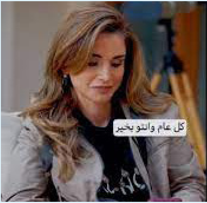
كل عام وانتو بخير

الانباط-عمان هنات جلالة الملكة رانيا العبدالله امس الجمعة، بحلول العام الهيلادي الجديد. وقالت جلالتها عبر استغرام "كل عام وانتو بخير."